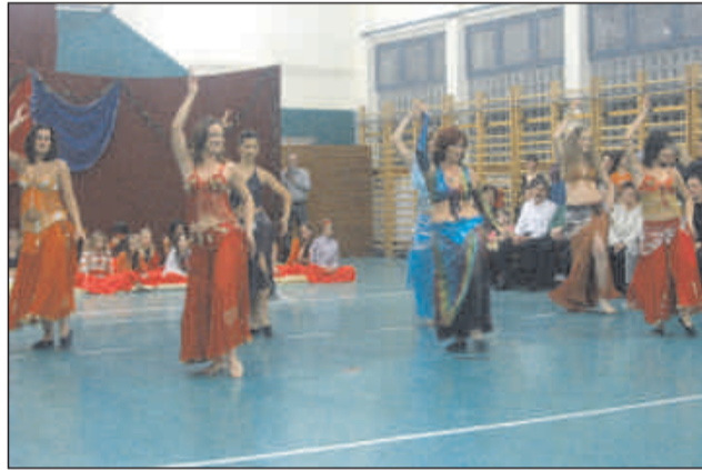
Heten az '55-ös fiatalembernek