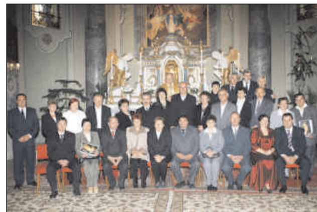
25 éves házasok

/Előző számunkban képes hírből tudósítottunk az eseményről, most a szervezők méltatásában olvashattak a jeles évfordulóról – a szerk./