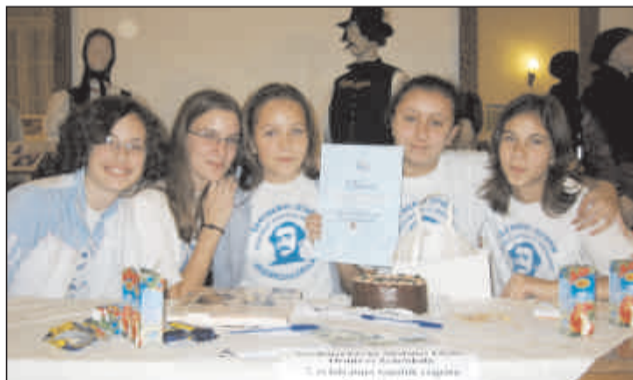
A II. helyen végzett csapat