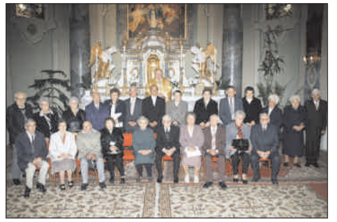
50 éves házasok

Egyházközségünk minden évben meghívja a jubiláló házastársakat, hogy az Egyház nagy családjában is ünnepelhesse, és ott adjanak hálát Istennek, ahol