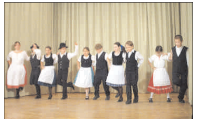
Kezdő fellépők a Parázs Pendzsomon