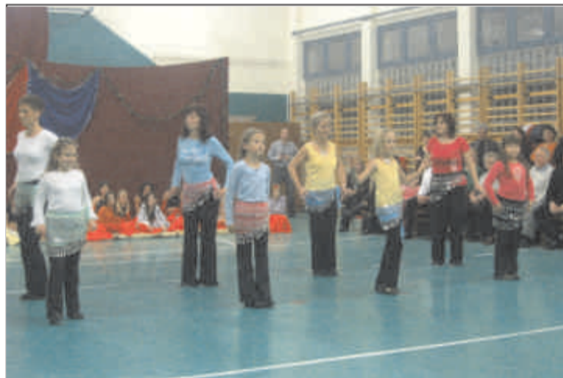
Meglepetéspárok: anyák és lányaik