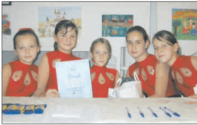
Az I. helyezett csapat