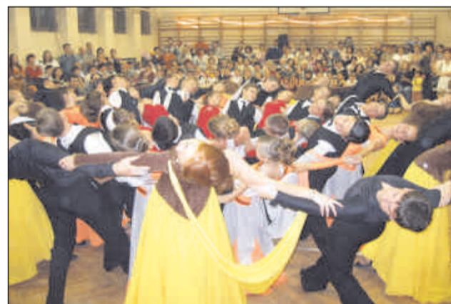
Egy látványos koreográfia