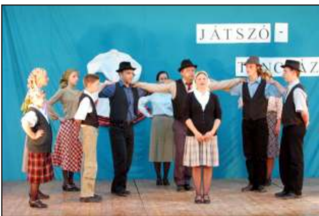
Színpadon a Parázs együttes

Hagyományainkhoz híven az idén is megrendeztük tavaszi Játszó-Tánc-Ház és néptáncbemutatónkat városunkban április 16-án a Széchenyi István Általános Iskola és Zeneiskola Szent Vince úti tornacsarnokában. A tavalyi ősszel megrendezésre került egész délutánt és estét átölelő esemény sikerén felbuzdulva tagjaink és segítők most is önzetlen és fáradhatatlan szervezésbe kezdtek. Az esetleges technikai, dologi és anyagi problémák áthidalásán és teljesítésén túl többek között 30 személyes meghívó, 1200 szórólap, számtalan plakát és a kábeltévén való megjelenés hirdette várossszerte programunkat. Nagy örömminkre a külföldi sikerekkel