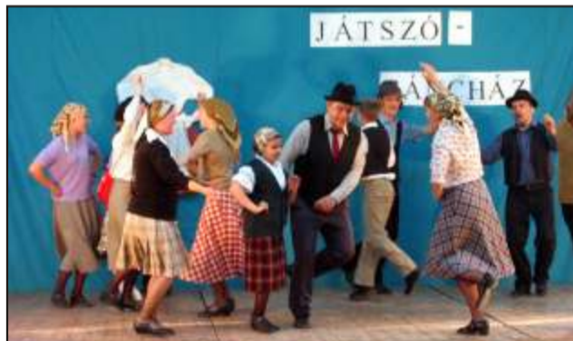
Parázs hangulat

Egy szép jászági népdalcsokor után már a jászapáti Hétszínvirág Néptáncgyűttes táncában gyönyörködhetünk. A csoport 1999-ben alakult, de mintegy 25 éves néptáncmúlta tekint vissza, hiszen Jászapáti város támogatásával a már akkor is meglévő együttes legaktívabb tagjaiból szerveződött. A sokszor egész estés műsort is bemutató csoport több alkalommal szerzett már külföldi elismerést a testvérvárosi kapcsolatokon kívül Svájcban, Franciaországban, Hollandiában, Angliában. A minősített együttes mezőcöntrói, madocsi, küküllő-menti és jászági táncokat adott elő. Művészeti vezetőjük Borics