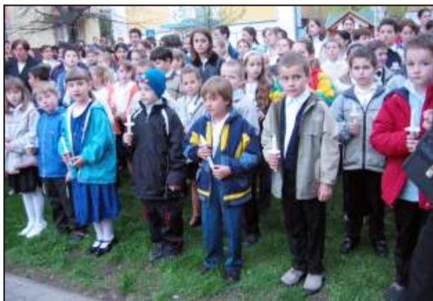
Az emlékező száz szál gyertya most nem éghetett csonkig