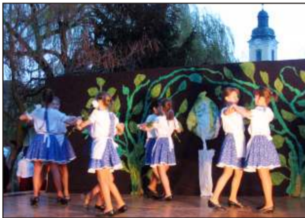
Vidám emlékezés a tragikus sorsú József Attilára

téjén április 10-én vasárnap este tartották volna az Időkapunál az ünnepséget. A rossz idő miatt ezt a következő hét csütörtökére kellett halasztani. Egész délután úgy tűnt, hogy