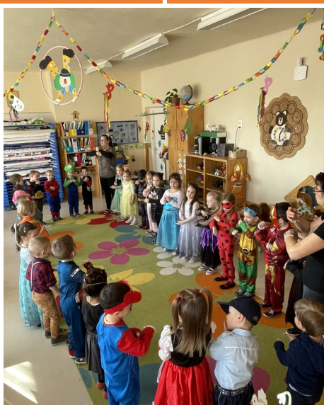
Télkergetés a Maci csoportban