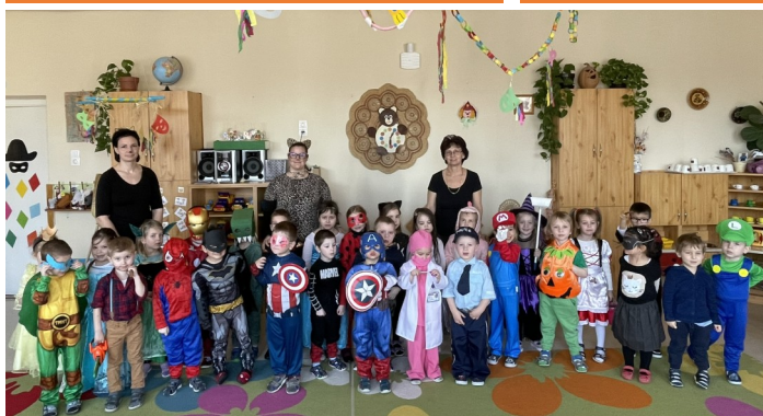
Jelmezben a Maci csoport