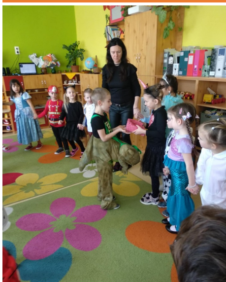
Télkergetés a Vuk csoportban