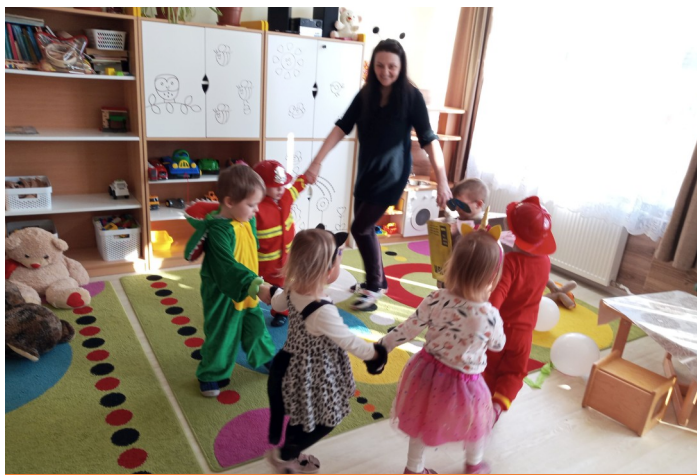
Farsang a bölcsődében