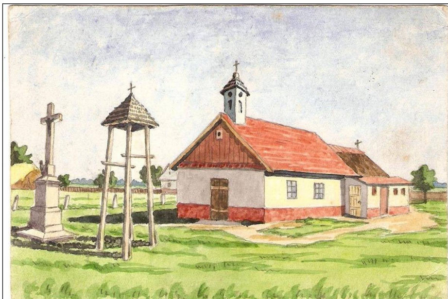
A tápiói kápolna 1951-ben. Balra állt az olvasókör épülete. (Soós István budapesti kitelepített rajza)