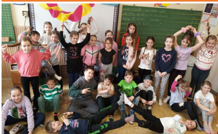
Farsang az iskolában