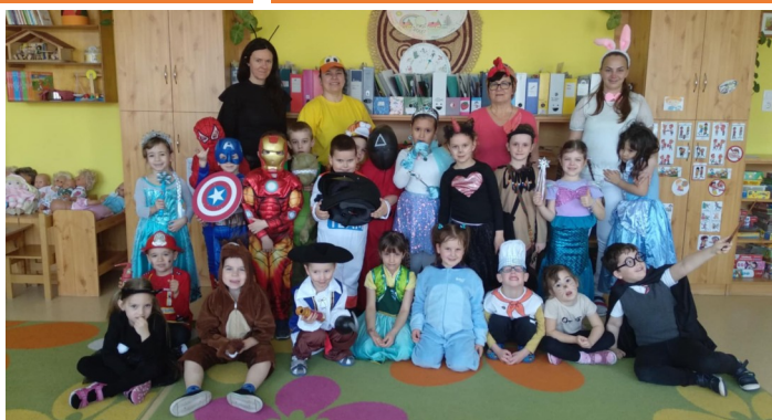
Jelmezben a Vuk csoport