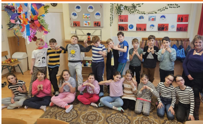
Farsang az iskolában