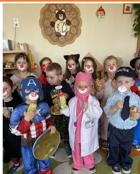
Móka és kacagás