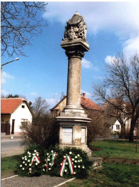
A jászberényi honvéd emlékművet 1870-ben állították

boldogháziaknak nagyon szoros volt a kapcsolata Jászberénnyel, ahol szinte minden családnak éltek