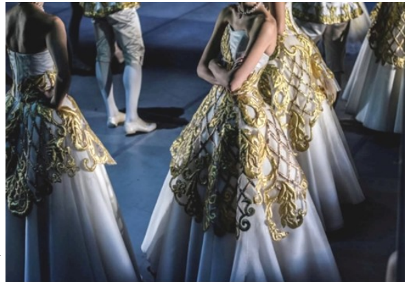
A Csipkerózsika című balett ruháiból

- A fejlesztő vagy matató könyvek filc lapokból állnak, és különböző kellékek, gombok, szalagok, kiegészítők használatával a gyerekek sokféle feladatot végezhetnek el játékosan. Közben fejlődik a fantá-