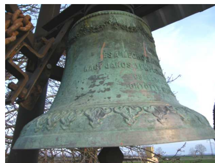
A temetői harang

A harang másik oldalán lévő, erősen oxidálódott, kopott kép, Szűz Máriát ábrázolja, karjaiban a gyermek Jézussal.