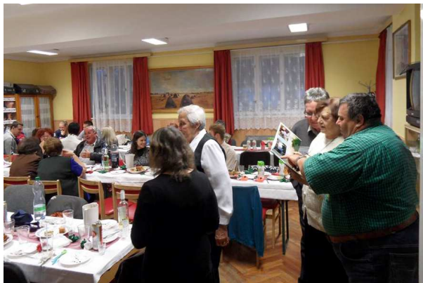
Emlékeket idézve ...

A mi népes családuknak a 90-es években évről évre csak temetések alkalmával találkozott. 1995-ben elhatároztuk, hogy tartunk unokatestvér találkozót, hogy ne csak haláleset alkalmával lássuk egymást. Ekkor már felmenőink közül csak egyetlen nagynénénk élt, és mi voltunk 14-en árván. Első alkalommal nagyon jól sikerült, és elhatároztuk,