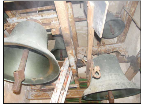
A jászboldogházi templom tornyában négy harang „lakik”.