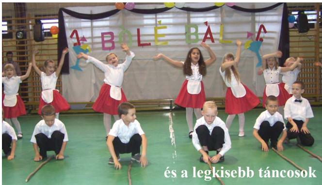
és a legkisebb táncosok