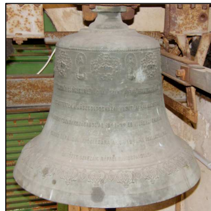
A középső harang

3. Az egyik kisharang a csíkosi kápolnából került ide, a Dalmadi család készítette. Jelenleg lélekharang, amely az eltávozók halálát adja hírül. Férfi halott halálát három, női halottét kettő, míg gyermekek halálát egy csendítés jelzi. A csendítéseket néhány másodperc szünet választja el, utána pedig a nagyharang és középső harang együtt szól az eltávozottért, amíg el nem temetik. A kisharang súlya 97 kg, a tartozékok súlya kb. 40 kg. Villannyal működik.