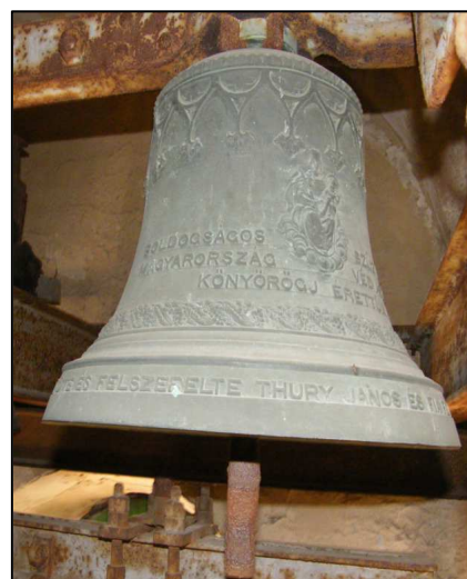
Az alsóboldogházi harang

ALSÓ BOLDOGHÁZAI ISKOLA TAGOK * ÉS AZ SZT. RÓZSA FÜZÉR ÉLŐ TAGJAI * CSINÁLTATTÁK 1896. ÉVBEN. *