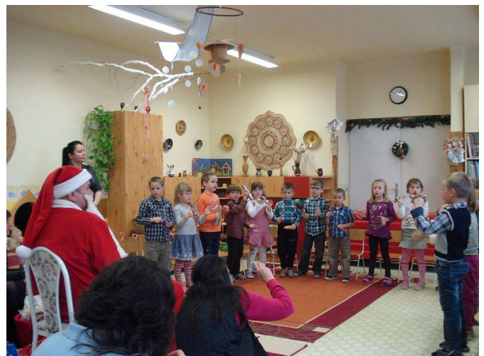
Mikulás a Maci csoportban

December utolsó hetére tervezzük a már néhány éve hagyománnyá vált mézeskalács sütést, valamint egy kézműves délelőttöt (december 18.) melyen részt vehetnek az érdeklődő szülők. Mindenkit szeretettel várunk!