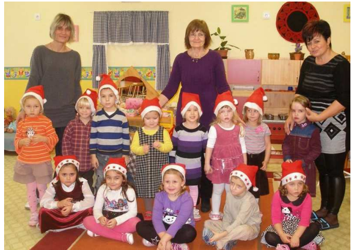
Így várta a Mikulást a Vuk csoport

2014. 11. 19-én a könyvtár szervezésében a Csillaghúr együttes zenés meseelőadásának aktív részesei lehettünk, majd 2014. 11. 26-án a tápiógyörgyei Zeneiskola boldogházi és tápiógyörgyei gyermekeinek hangszeres bemutatóját csodálhattuk meg óvodás gyermekeinkkel együtt. Köszönjük szépen a meghívást, a színvonalas előadásokat, örömmel mentünk!