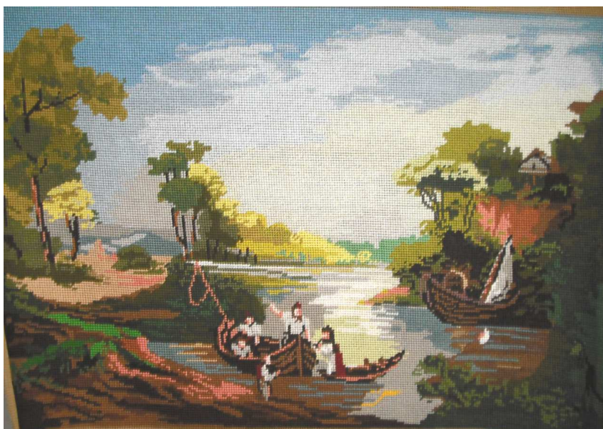
A legkedvesebb kép