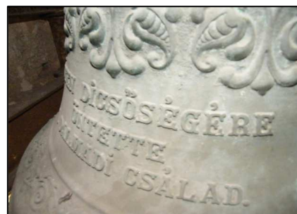
A csíkosi harang