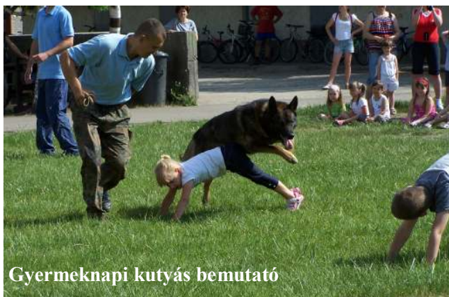
Gyermeknap kutyás bemutató