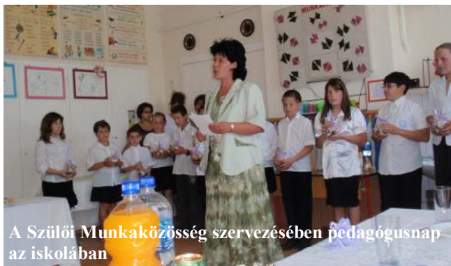
A Szülői Munkaközösség szervezésében pedagógusnap az iskolában