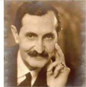
Dr. Ugron Gábor a Wekerle kormány belügyminisztere