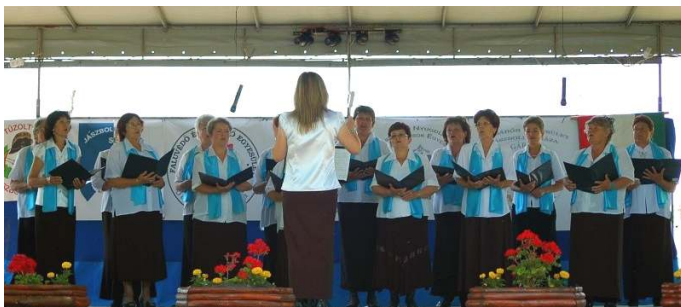
A jászboldogházi Csillagvirág Amatőr Kamarakórus