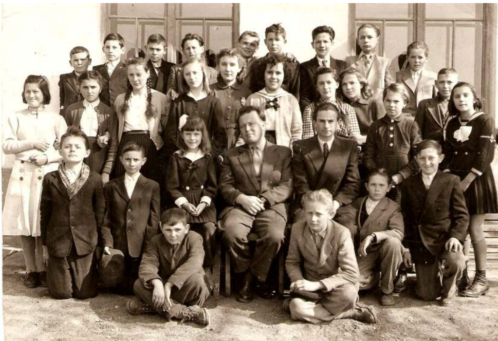
A csoportkép 1958-ban készült az iskola felső tagozatos diákjairól.

Nosztagiázva nézegettük a csoportképet a jelenlévő osztálytársakkal, ami sajnos bizony már hiányos - az egykori iskolatársak közül többen már nem lehetnek velünk. Jó érzés arra gondolni, hogy az emlékkő - tanáraink nevének és az iskola helyének túl - most már az ő emléküket is megőrzi.