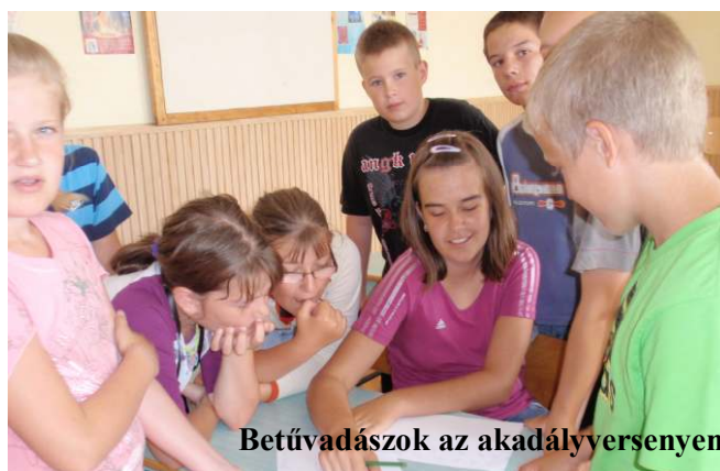
Betűvadászok az akadályversenyen