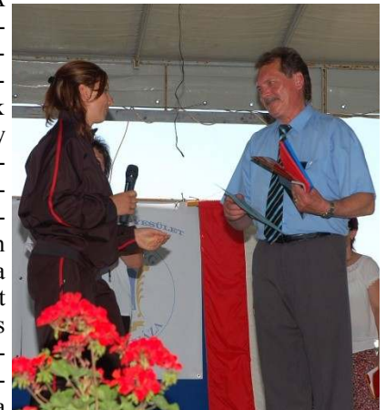
Yakuzák SE jászboldogházi dojoja a Polifoam Kft. jótékonyágának köszönhetően tatamit kapott