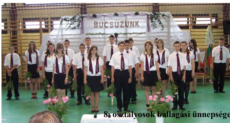
8. osztályosok ballagási ünnepsége