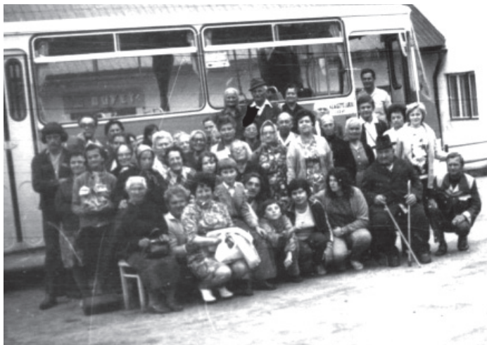
Lengyelországból haza tartó ványai katolikus turisták

Tevékenysége külön fejezetét képezte az utazásszervezés. Híveinek autóbusszos kirándulásokat szervezett a hazai búcsúkra, sőt Erdélybe és Lengyelországba is ellátogattak. Nagymamám hetvenegynéhány éves korában így jutott el először külföldre. Meglátta a Kárpátok bérceit, imádkozhatott a Czeszochowai Fekete Madonnához, sétálhatott Krakkó gyönyörű főterén.