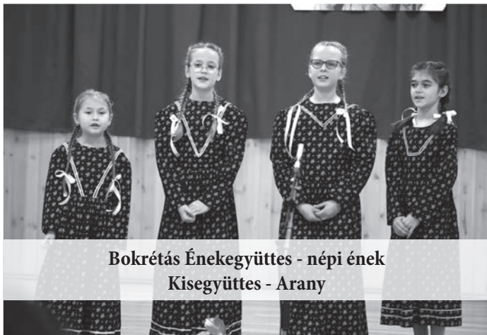
Bokrétás Énekegyüttes - népi ének Kisegyeites - Arany