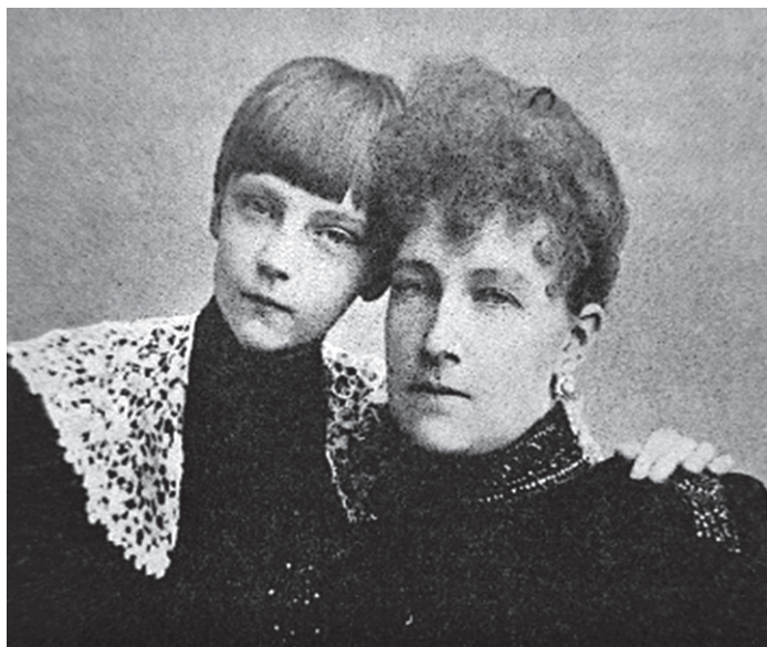
Az özvegy Stefánia Erzsivel, Rudolf trónörökös egyetlen gyermekével, aki mindössze ötéves volt édesapja halálakor. (Későbbi felvétel)

Az Osztrák-Magyar Monarchia Írásban és Képben című kiadvány patrónusságát most a királyfi özvegye, Stefánia főhercegné vette át, ehhez Ferenc Józseftől engedélyt kért és kapott. Február 7-én audiencián fogadta Jókait a trónörökös özvegye, lelkesedéssel beszélt a vállalt feladatáról. Jókai még tervezett néhány cikket, de innentől már csak kevésbé érdekli a könyv.