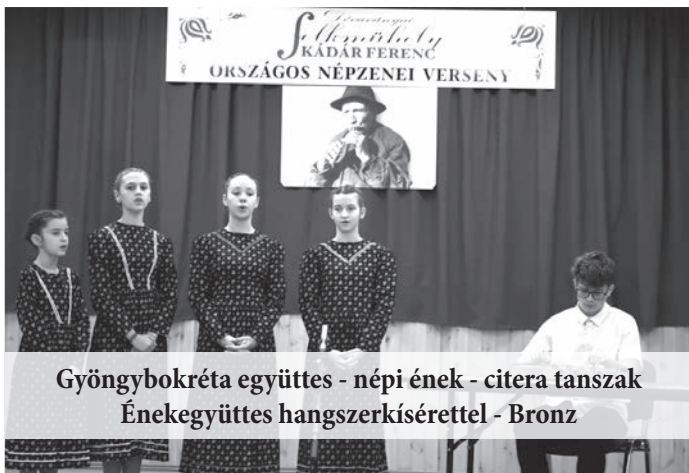
Gyöngybokréta együttes - népi ének - citera tanszak Énekegyüttes hangszerkísérettel - Bronz