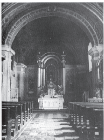
A dévaványai katolikus templom eredeti belső díszítése