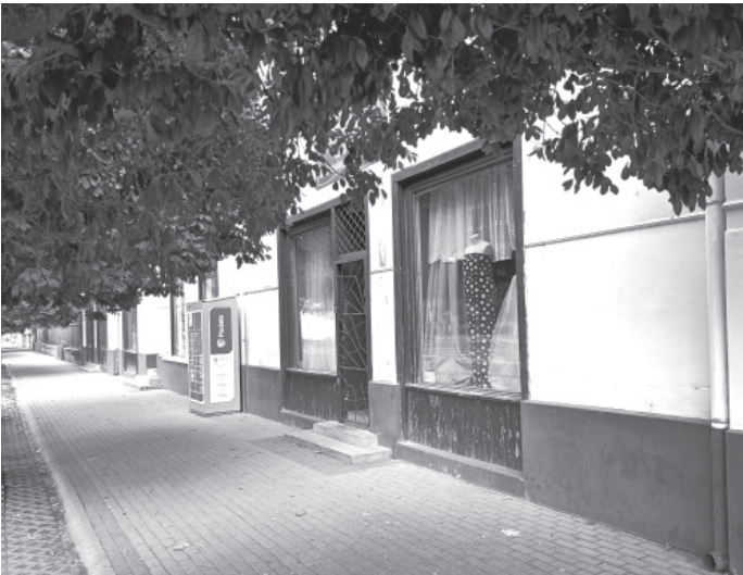
A „Sommer patika” oldalról, napjainkban

családja révén ez nem szegte kedvét, hogy lehetőségeihez és idejéhez mérten segíteni próbáljon a helyieknek. Legyen ez mind ma-