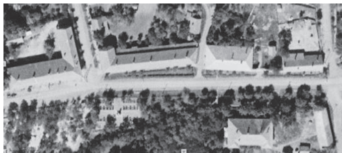
A Sommer ház felülről, a kép jobb felső sarkában, egy 1961-ben készült légifotón