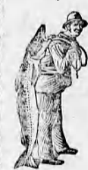
Az Emulsió vásárlásánál a SCOTT-féle módszer véglegét — a halszét — kérjük figyelembe venni.

Ama kiváló és koncentrált táplálék, amely a SCOTT-féle Emulsió ban foglaltatik, táplálja a csontokat, s azokat keményekké és egyenesekké teszi. E szer hatása alatt a csontokat körülvevő hús egészséges és szilára lesz.