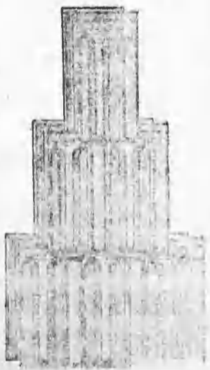
Nagykikindai gyártmány. Bohn-féle szab. biztonsági átfedő-cserep 272. szám.

Képes árjegyzék és minták kívánatra ingyen és bérmentve.