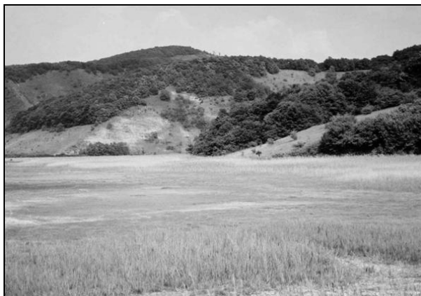
A széki szikes a Kis Udvarnak völgyel