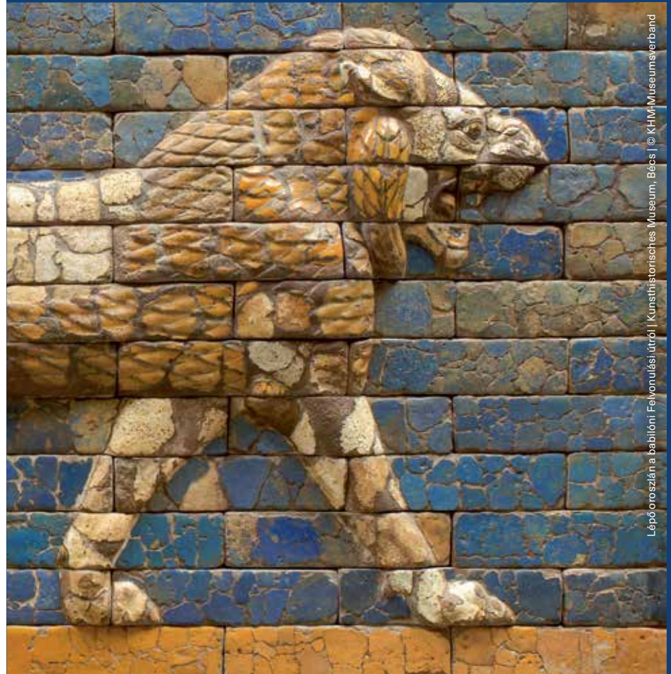
Lépcsőországnál a babilóni Felvonulási útról | Kunsthistorisches Museum, Bécs