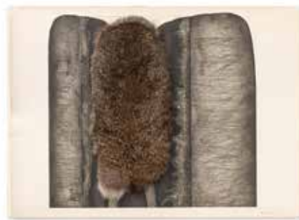
Maurer Dóra: PB 0 (Ember hegygel), 1969 – aquatinta, mezzotinto, hidegtű, rézkarc, nyúlászór, 50x70 cm, MD55, forrás: Vintage Galéria