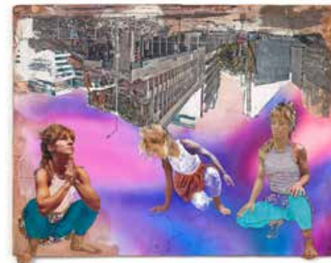
Gaál Kata: Fejjel lefelé (2024 – 101x86 cm, vegyes technika, fatábla), forrás: Vártek Galéria