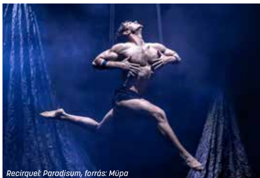
Recirquel: Paradisum