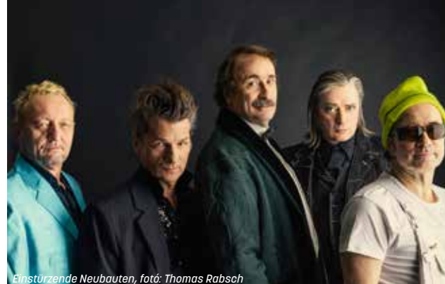
Einstürzende Neubauten

nista művei szólnak majd. Költészet és muzsika sajátos kapcsolódásának lehetünk tanúi Martin Haselböck és az Orchester Wiener Akademie estjén, amelynek szólistája a fiatal zongoristacsillag, Ránki Fülöp lesz. Könnyedebb műfajokban sem lesz hiány: a Bachot és az elektronikát ugyanolyan lelkesedéssel tanulmányozó luxemburgi születésű zongorista-zeneszerző, Francesco Tristano koncertjét a klasszikus és a modern zene rajon-