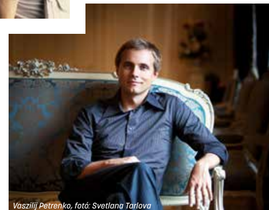
Vaszilij Petrenko