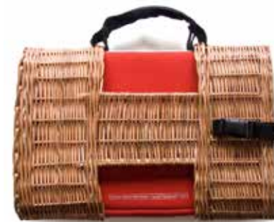
Nocorruption brand, laptop táskák, model Rami fotó: El-Hassan Róza, 2009