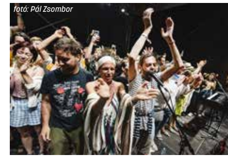
fotó: Pál Zsombor