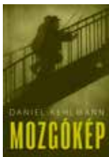
Daniel Kehlmann: Mozgóképek Magvető Kiadó, Megjelenés: 2024. április 4.