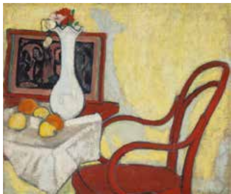
Galimberti Sándor: Enteriőr Thonet-székkal és Gauguin metszettel