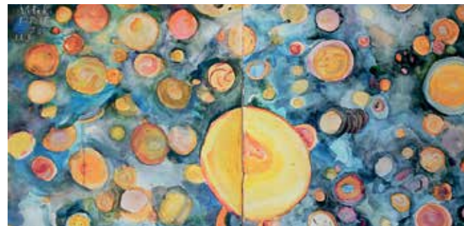
Ujházi Péter: Vidéki égbolt forrás: VárfoK Galéria