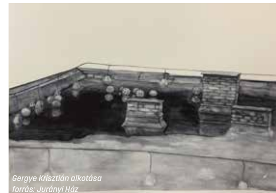
Gergye Krisztián alkotása