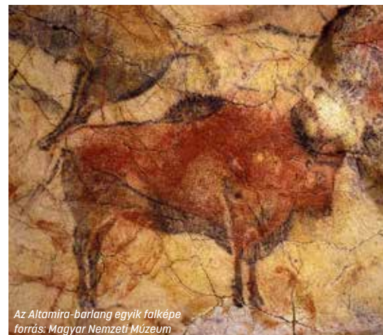
Az Altamira-barlang egyik falképe