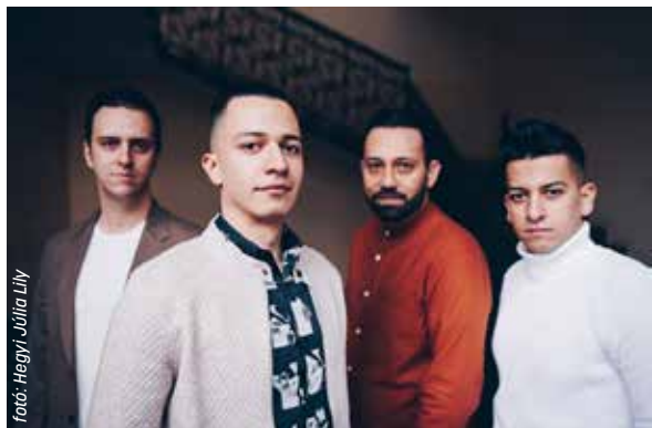
Fotó: Hegyi Júlia Lily