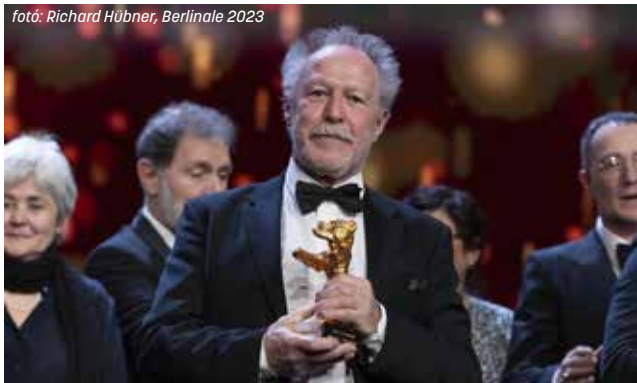
Berlinale 2023

A Nemzeti Színház Vidnyánszky Attila vezetésével 2014 óta rendez meg a Madách Nemzetközi Színházi Találkozót. Minden évben többtucatnyi külföldi és határon túli magyar színházi produkció érkezik a fesztivál szervezésében hazánkba. Idén a MITEM-et április 16. és június 18. között rendezik meg a Színházi Olimpia részeként. Az érdeklődők 35 előadást tekinthetnek meg a fesztiválprogramban, közöttük a rendezvény nyitásaként a Színházi Olimpia ötletgazdájának és alapítójának, Theodórosz Terzopolosznak a Nóra -rendezését április 16-án és 17-én. A világpolitikai helyzet miatt ebben az évben orosz társulatok előadásai nem szerepelnek a fesztiválkínálatban.