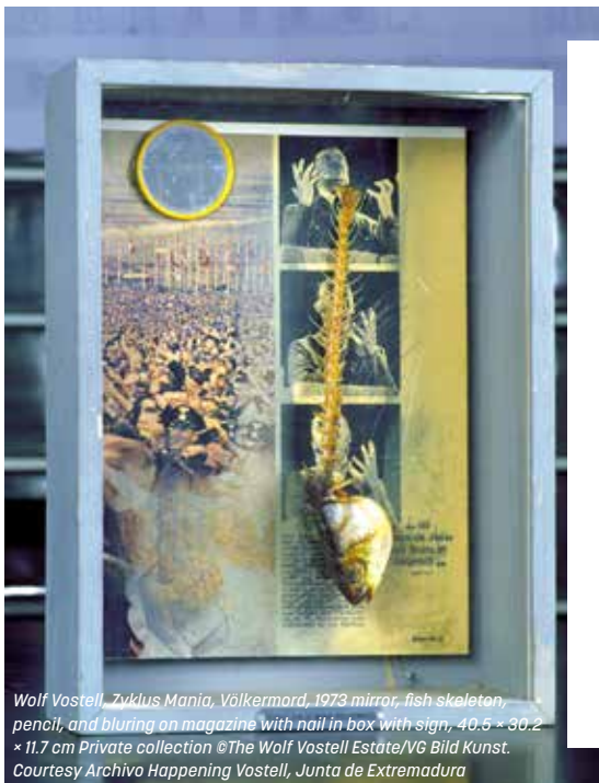
Wolf Vostell, Zyklus Mania, Völkermord, 1973, mirror, fish skeleton, pencil, and blurring on magazine with nail in box with sign, 40.5 x 30.2 x 11.7 cm Private collection