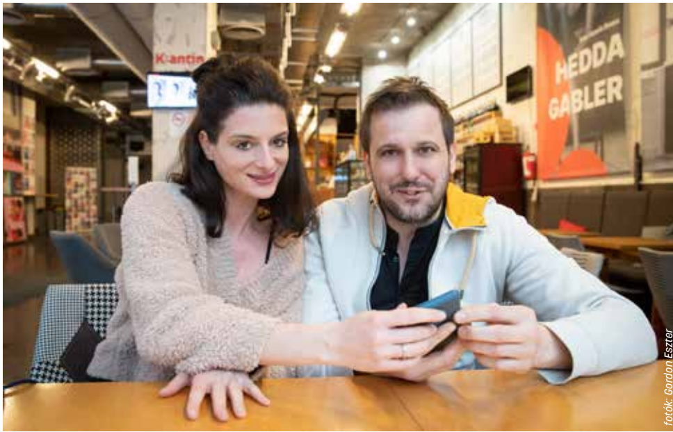
forók: Gordon Eszter