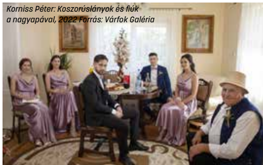
Korniss Péter: Koszorúslányok és fiúk a nagyapával, 2022 Forrás: Várfok Galéria

március 16.–április 14. B32 Galéria és Kultúrtér