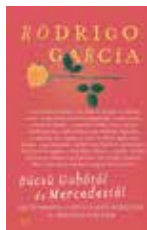
Rodrigo García: Búcsú Gabótól és Mercedestől Magvető Kiadó Megjelenés: 2022. május 4.