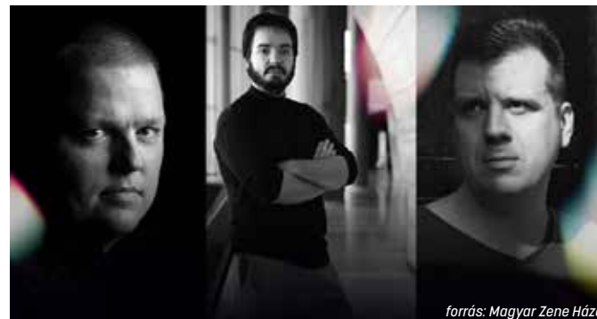
forrás: Magyar Zene Háza