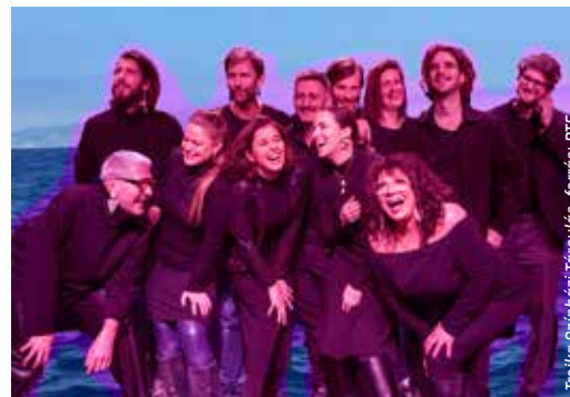
Trojka Színházi Társulás