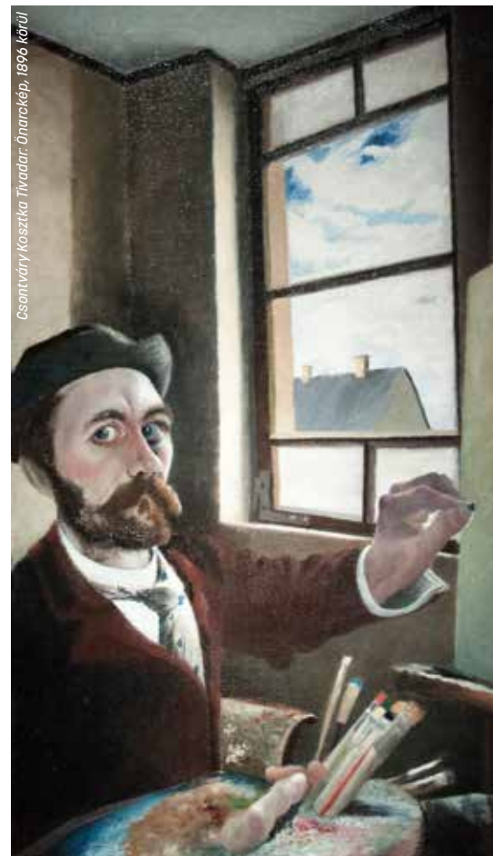
Csontváry Keszthelyi Thivadar. Önarckép, 1896 körül