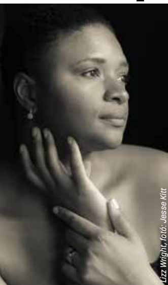
Lizz Wright