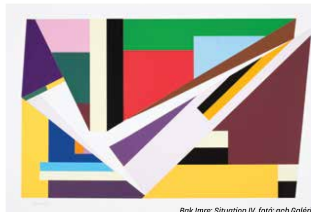
Bak Imre: Situation IV, fotó: acb Galéria