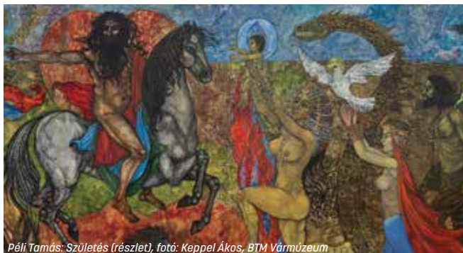
Péli Tamás: Születés (részlet), fotó: Keppel Ákos, BTM Vármúzeum