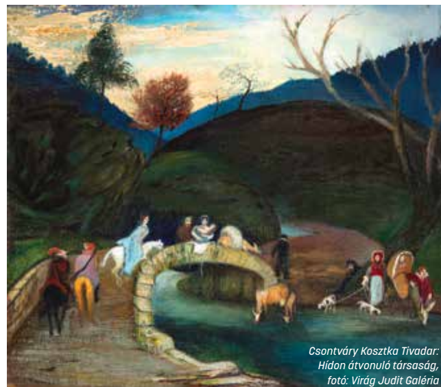
Csontváry Kosztka Tivadar: Hídon átvonuló társaság