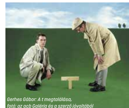
Gerhes Gábor: A t megtalálása