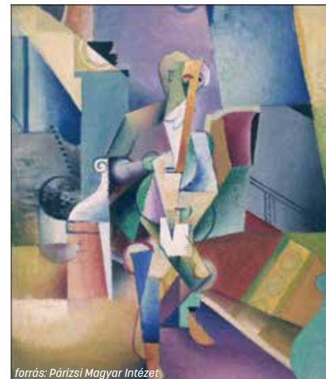
forrás: Párizsi Magyar Intézet

május 21.–augusztus 14. Magyar Intézet, Párizs