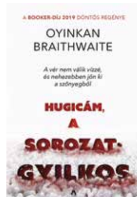
OYINKAN BRAITHWAITE: HUGICÁM, A SOROZATGYILKOS

Egy anyuka nem tud mesékkel kárt okozni, terápiás munkában viszont lehet. Egy gyereknek az a fontos, hogy sok mesét halljon. Az a lényeg, hogy mintákat mutassunk neki a mesékkel, és a gyerek kiválasztja azt, ami az övé. Ráismer a saját meséjére, amelyre nyugodtan rábízhatja magát, mert abban ott van a megoldás is.