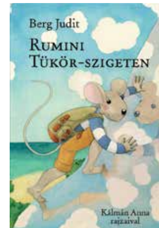
BERG JUDIT: RUMINI TÜKÖR-SZIGETEN

L&L Kiadó, Megjelenés: 2019. december 6.