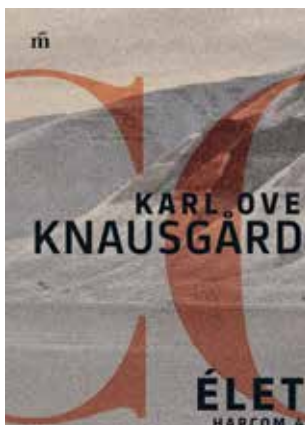
KARL OVE KNAUSGÁRD: ÉLET - HARCUM 4.

Vajon miért kuncoghattak Mozart salzburgi ismerősei a „Haffner”-szerenád mai fülünk számára éppenséggel búbanatosnak hangzó menüettjét hallva? Mi lehet az értelme annak, ha Haydn időskori miséjében a „Te elveszed a világ bűneit” szavakat A teremtés oratórium egy szexuális áthallásokkal is terhes dallamára kell énekelni? A 98. szimfónia lassú tétele valóban Mozart halálára írott rekviem volna? S ki lehetett a titokzatos „Zizini gróf”, akit Haydn kottatárának jegyzéke egy „cigányos” zongoradarab szerzőjeként emleget? 24 tanulmány, amely Haydn és Mozart zenéjét vizsgálja. OSZK Kiadó, 2019