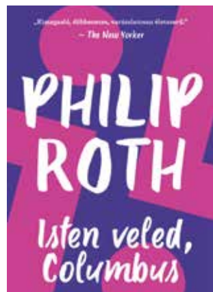
PHILIP ROTH: ISTEN VELED, COLUMBUS

Először jelenik meg magyarul Philip Roth 1959-ben írt első kötete, amelyet megjelenésekor Saul Bellow így méltatott: „Első könyv az Isten veled, Columbus , de nem egy kezdő könyve. Legtöbbünk bőmbőlve jön a világra, vakon és pucéron, ám Roth úgy pottyyan ide, hogy körme van, haja, foga, és értelmesen beszél. Huszonhat éves fejjel már profi, szellemes, erőteljes és virtuóz.” A címadó kisregény első pillantásra klasszikus „szegény fiú-gazdag lány” szerelmi történet, de a cselekmény, a két zsidó család tagjainak sokszínű, markáns és szarkasztikus megrajzolása és a korabeli amerikai körkép korántsem szokványos.