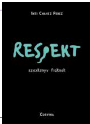
INTI CHAVEZ PEREZ: RESPEKT - SZEKÖNYV FIÚKNAK

Mit is jelent férfinak lenni? Mit takar az emberek testbeszéde, milyen heterónak, melegnek vagy binek lenni? És hogyan kerül a képbe a tisztület, a legfontosabb dolog a szexben és a szerelemben? Hogyan kell flörtölni, milyen a jó előjáték, hogyan kell csókolózni, milyen a szex? Ebben a könyvben pont azokról a dolgokról olvashatsz, amelyek minden fiút foglalkoztatnak, de ritkán mernek kérdezni róluk. Inti Chavez Perez egy jó fej báty vagy idősebb barát hangján vezet be a szexualitás rejtelmeibe az elejétől a végéig, az első szárnypróbálgatástól a komoly párkapcsolatig. Perez a szexuális felvilágosítás elismert szakembere Svédországban, számos iskolában beszélt már fiúkkal (és lányokkal) a szerelemről és a szexről.