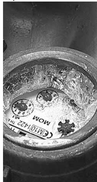
Szétfagyott fogyasztásmérő óra cseréje költséges tétel

ezek bár fagyállóak, az élet-tartamukat meghosszabbíthatja, ha víztelenítve vannak.