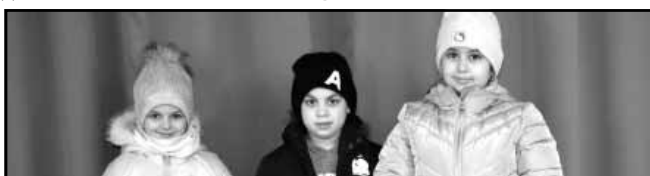
Az első és második osztályosok díjazottjai