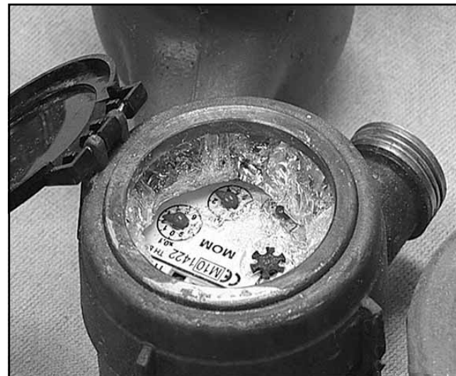
Szétfagyott fogyasztásmérő óra cseréje költséges tétel

A télen is lakott ingatlanoknál fontos, hogy a vízmérőakna szigetelése megtörténjen. Ugyanakkor azokra a vezeték- szakaszokra is kiemelt figyelemmel kell lenni, amelyek kevésbé védett helyen (pincében, falon kívül) vannak, ezeket is cél- szerű szigetelőanyaggal védeni. A kerti csapokat víztelení- teni kell, valamint a telepített öntözőberendezésekre is érde- mes jobban odafigyelni, mert ezek bár fagyállóak, az élettár- tamukat meghosszabbíthatja, ha víztelenítve vannak.