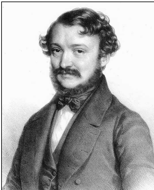
Erkel Ferenc (Barabás Miklós litográfiaja 1845.)