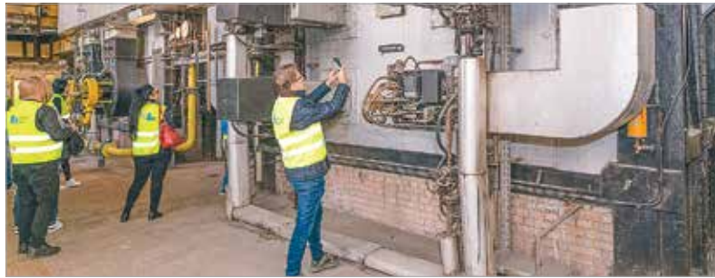
A program az országban közel hétezer érdeklődőt vonzott, Fehérváron is sokan nézték meg a Király sori telephelyet

működésbe lép, így a kazánok alkalmanként itt is bekapcsolnak. A látogatók különleges ipartörténeti túrán vettek részt, ahol egy üzemén kívüli gőzturbinát és egy hatalmas, ötezer köbméteres, kitisztított olajtartály belsejét is megtekinthették, és bepillantást nyerhettek az erőmű technológiájába és működésébe is. Az országos programot a Magyar