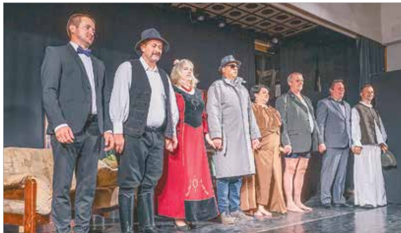
A fesztivál üde színfoltja volt a csíksomortáni Lármafa Egyesület színjátszó csoportjának vígjátéka