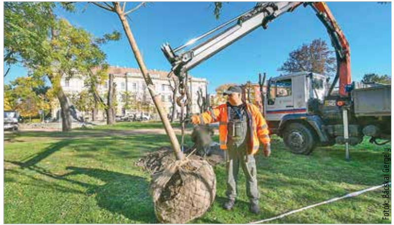
A mostani ültetéssel folytatódik a Zichy liget faállományának frissítése

Az augusztus tizennyolcadikai vihar a Zichy ligetben is komoly pusztítást végzett. A fák statikai állapota meggyengült, számos példány balesetveszélyessé vált. A menthetetlen fákat hétfőn vágták ki a Városgondnokság szakemberei,