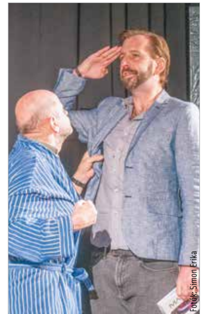
Elismerés fogadta a Péntek 3 Tejátum előadását is