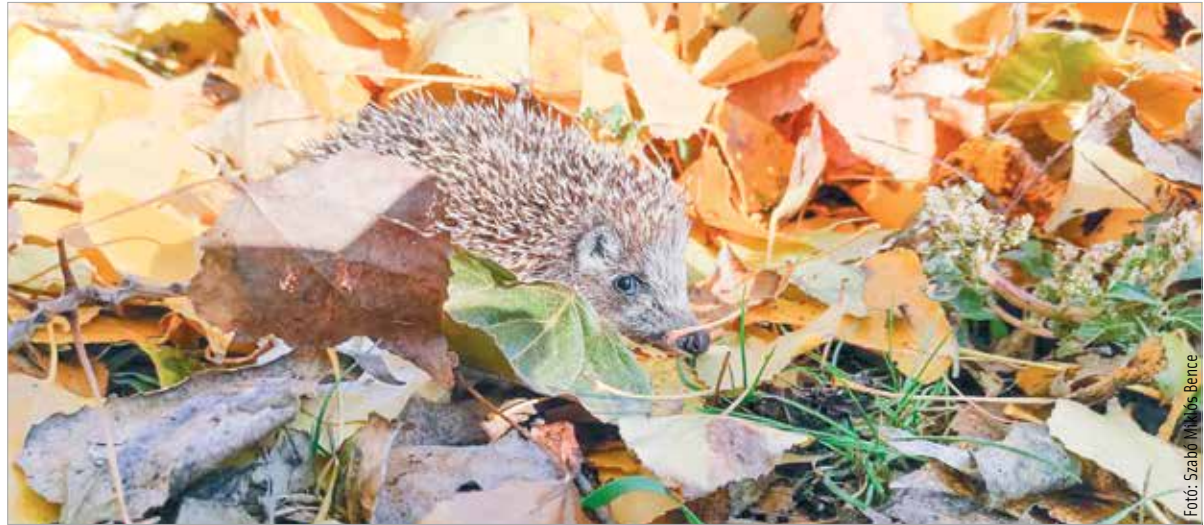
A mindenevő sünök a sokak által utált kártevőket, például a poloskákat is pusztítják a konyhakertekben