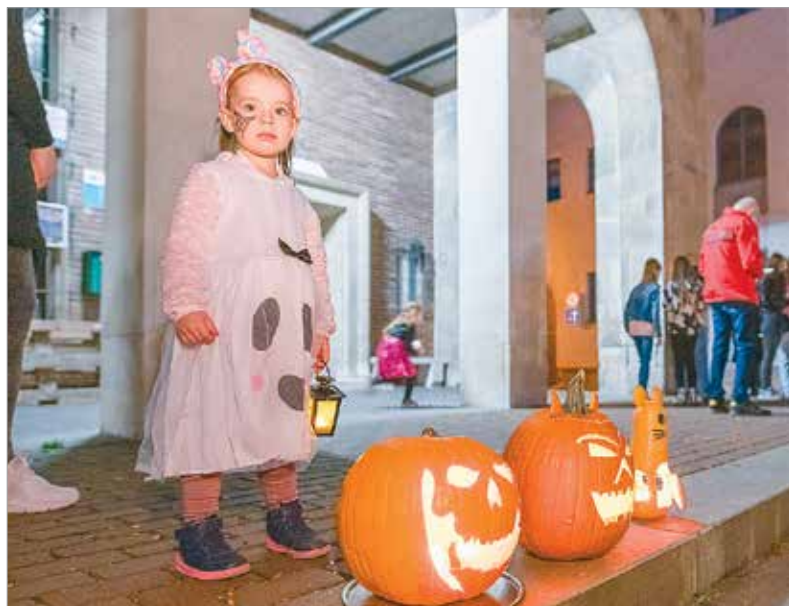
Az V. Fehérvári Töklámpás Fesztiválra sokan az alkalomhoz illő jelmezt öltöttek