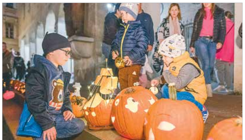
A különféle technikákkal készült alkotások között voltak klasszikus figurák, kreatív, egyenesen ijesztő arcok és állatok, sőt még egy hajó is!