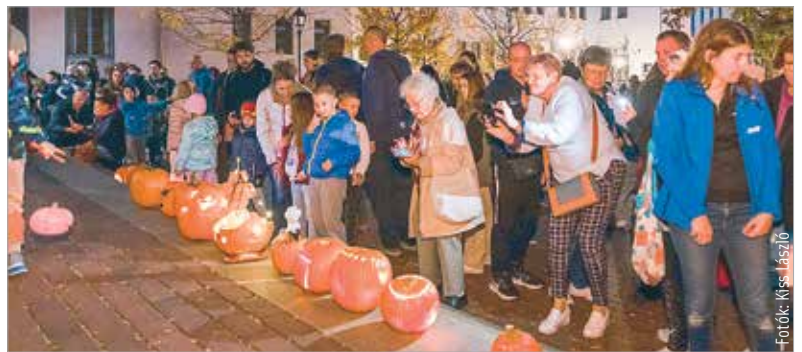
A Bartók Béla térre rengetegen érkeztek megcsodálni a családok által készített töklámpásokat

töklámpások faragása is. Mára már Magyarországon is az őszi ünnepek része lett ez a szokás, hiszen egy olyan közös program lehet, ami összehozza a családokat. A Fehérvár Média centrum pedig a várost is szeretne volna kicsit összehozni, így vasárnap immár ötödik alkalommal rendezték meg a Fehérvári Töklámpás Fesztivált.