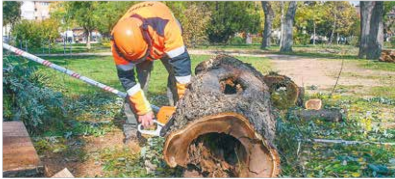
A kivágott öreg fákat balesetveszélyessé tette a komoly korhadás

kedden pedig meg is történt ezek pótlása. Cser-Palkovics András polgármester lapunknak elmondta, hogy a Zichy ligeti fapótlás után még az idei évben ötszáz fát fognak elültetni a szakemberek Székesfehérvár különböző területein. Lesz még faültetés a Mancz János utcában, a régi aszfaltos sportpálya helyén, ahol megannyi cserjét, illetve díszfüveket is ültetnek. A Vár körüton is pótolják a díszcseresznyéket, és a Géza