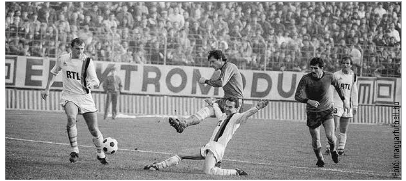
A megismélt visszavágón csütörtök kora délután is megtelt a Sóstói Stadion