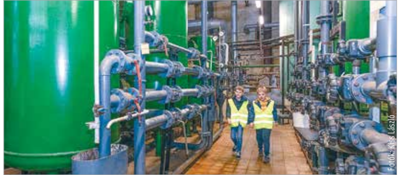
Az Erőművek éjszakája országsszerte több mint hatvan létesítményre terjedt ki, köztük erőművekre, szennyvíztisztítókra, vízművekre, víztornyokra és hulladékhasznosítókra

séggel egészítenek ki. Az évtizedek során a telephely funkciója fokozatosan átalakult. A villamosenergia-termelésről a hangsúly a hőtermelésre helyeződött át. A helyszín jelentős ipari örökséget képvisel, bemutatva a több mint egy évszázados energetikai múltat és az iparág fejlődésének fontos szakaszait. Ma már nem ez a fő hőtermelő telephely, de a téli időszakban és tartaléküzemként ez a helyszín is szükség szerint