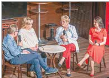
A család számára is megerősítést nyújtott az elkészült film