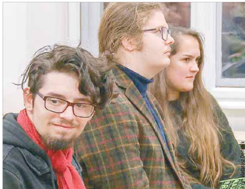
Az alkotások olyan fiatalok művei, akik a jövőben helyet kaphatnak városunk irodalmi életében

a kötet szerkesztője is örömeinek adott hangot, hogy a vers és prózaíró fiatalok szárnypróbálgatásai, az antológiában megjelent művek hiteles visszacsatolásai az együtt töltött időszaknak.