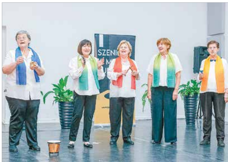
Színek, hangok, jókedv – a hagyományt felélesztve érdemes volt ismét megrendezni a kulturális seregszemlét!