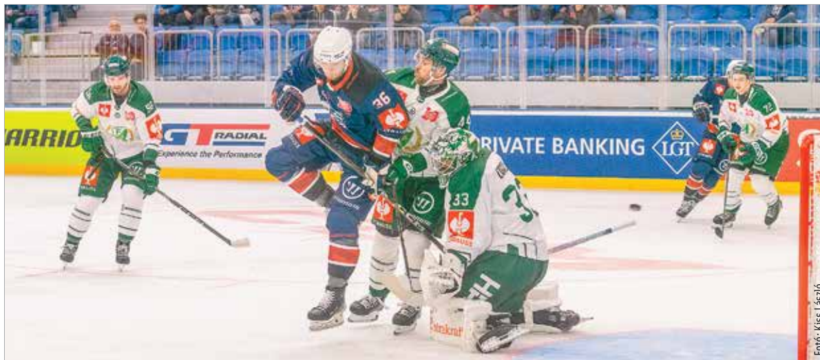
Nagyon erős ellenfelekkel szemben edződhetnek Erdély Csanádék

A CHL, vagyis az európai Bajnokok Ligája hat csoportmeccsén pont nélkül maradt a Volán, de csak a legelső, pardubicei találkozón ütötték ki. Az a 7-0-s vereség megmutatta, mennyivel jobban kell figyelni már az első percektől kezdve