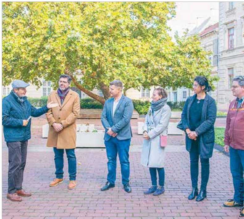
A jövő nyárig tartó időszakban öt város, Gyulafehérvár, Kranj, Opole, Zadar és Székesfehérvár valósít meg közös programokat. Az első állomás novemberben Gyulafehérvár lesz.

Jövő nyáron a projekt záróeseményének középpontjába Székesfehérvár kerül: az előadóművészeti fesztiválon az európai kulturális örökség sokszínűségét mutatják majd be.