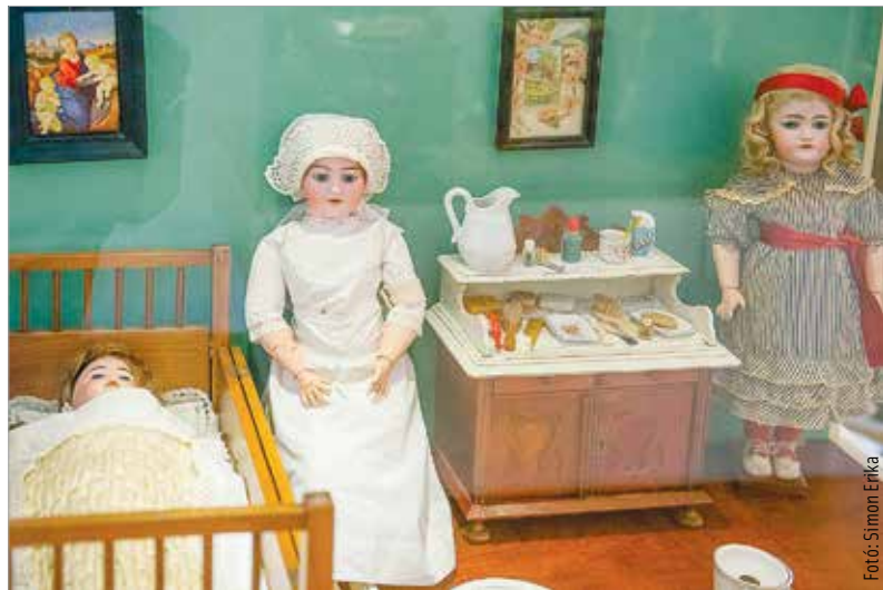
A gyűjtemény minden darabjának története van. Sok játékról az is tudni lehet, hogy ki készítette, ki volt az eredeti tulajdonosa, és hogyan alakult a sorsa, amíg a gyűjteménybe került.