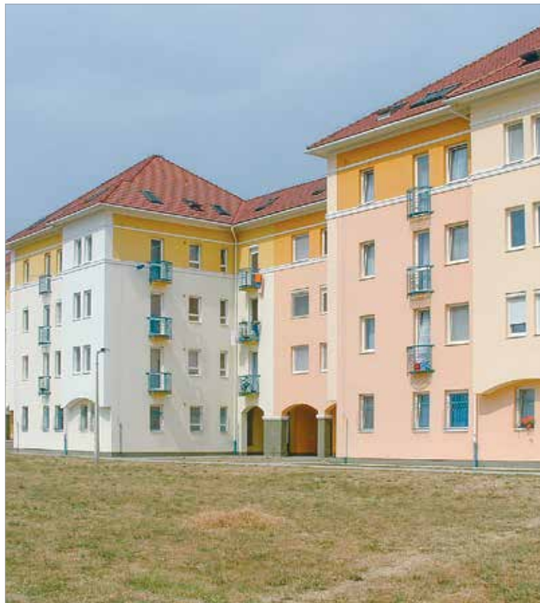
A Szépház által épített Gáncs Pál utcai lakótelep

2004-ben az egykori IKV építőipari szegmense a Szépház Építő Kft.-be került kiszervezésre, melynek fő profilja a társasházak kivitelezése volt. Az új cég az építőipar zsugorodásának következtében 2012 decemberében beolvadt a SZÉPHÓ Zrt.-be. Ezzel megszűnt a vállalat építőipari tevékenysége, és innentől a szakemberek feladata elsősorban a saját tulajdonban lévő ingatlanok felújítása, karbantartása, állagmegóvása volt.