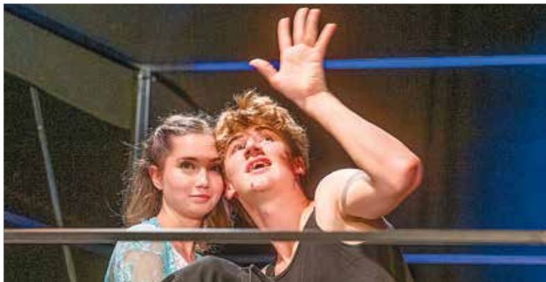
Égen és földön...