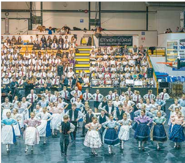
Az ünnep része volt a néptánc is