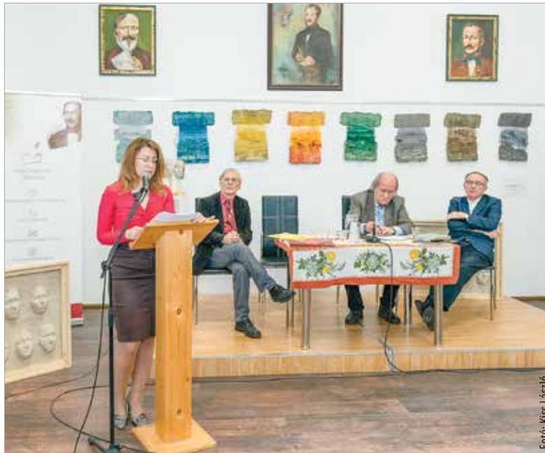
A kétnapos rendezvényen a résztvevők teljesítették küldetésüket, a magyar nyelv egyetemességének szolgálatát