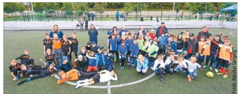
A Felsővárosi, a Hétvezér, a Zentai, a Kossuth, a Széna téri és a Vasvári negyedik osztályos tanulóinak csapatai küzdöttek meg egymással a Túrósáki úti focipályán