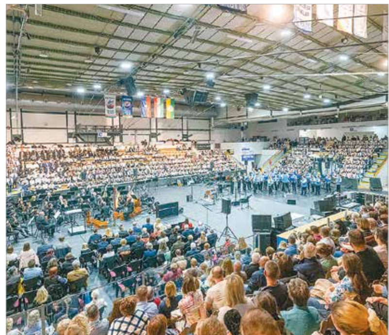
Ezúttal is telt ház volt az Alba Regia Sportcsarnokban