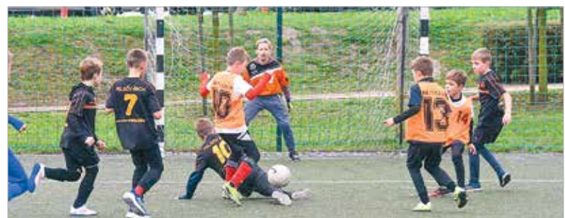
Két csoportra osztva mérkőztek meg egymással a csapatok, majd helyosztókkal döntötték el a végeredményt. A legjobbnak a Kossuth iskola diákjai bizonyultak.