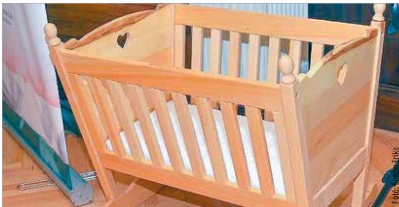
Az egyesület a Három Királyfi, Három Királyné Alapítvány felhívására jelentkezve kapta meg az első bölcsőt, amelyhez az évek során két másik is társult

használatra fából készült bölcsőket az arra jelentkező, gyermeket váró családok számára. Az egyesület célja, hogy támogassa a kisgyermeket tervező és vállaló családokat abban, hogy a kívánt gyermekek megszülessenek. Ezt a célt segíti a vándorbölcső, amelyet immár huszonnegyedik alkalommal adnak ingyenes használatba a nyertes családoknak, egészen addig, míg az új családtag ki nem nővi. Az egyesület október huszonhetedikéig várja a családok jelentkezését a szenaegyesulet@gmail.com e-mail-címen, egy rövid bemutatkozás kíséretében. (Forrás: ÖKK)