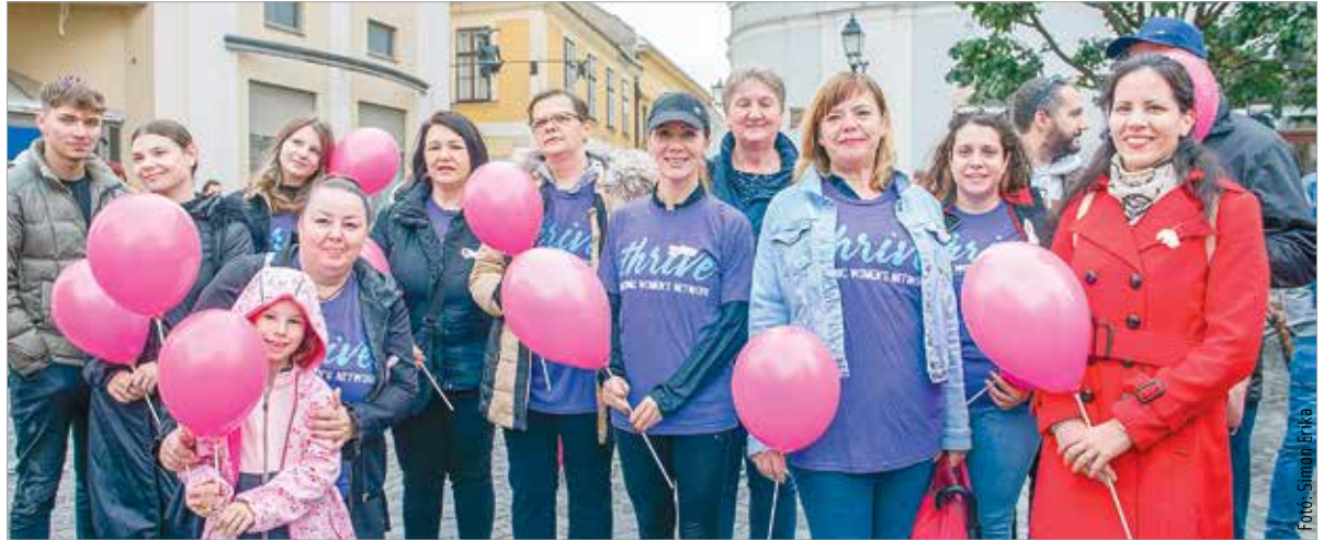
Tizennyolcadik alkalommal hívták fel a figyelmet a megelőzésre, a szűrővizsgálatok fontosságára