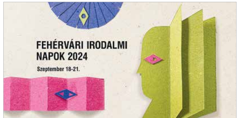
A Fehérvári Irodalmi Napok rendezvénysorozata nemcsak irodalmi élményeket kínál!