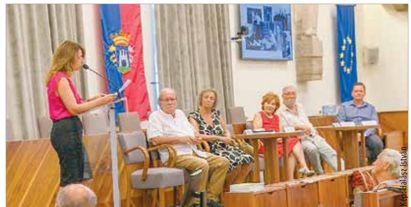
A költő, író, műfordító életművét a versek mellett prózai alkotásainak gazdag sora – társadalmi és történelmi regények, háborús napló, memoár, népszerű irodalomtörténet és műfordítások – teszik teljessé