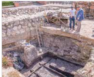
Az ácsolt faszervezet jól látható az ásatási szelvényben