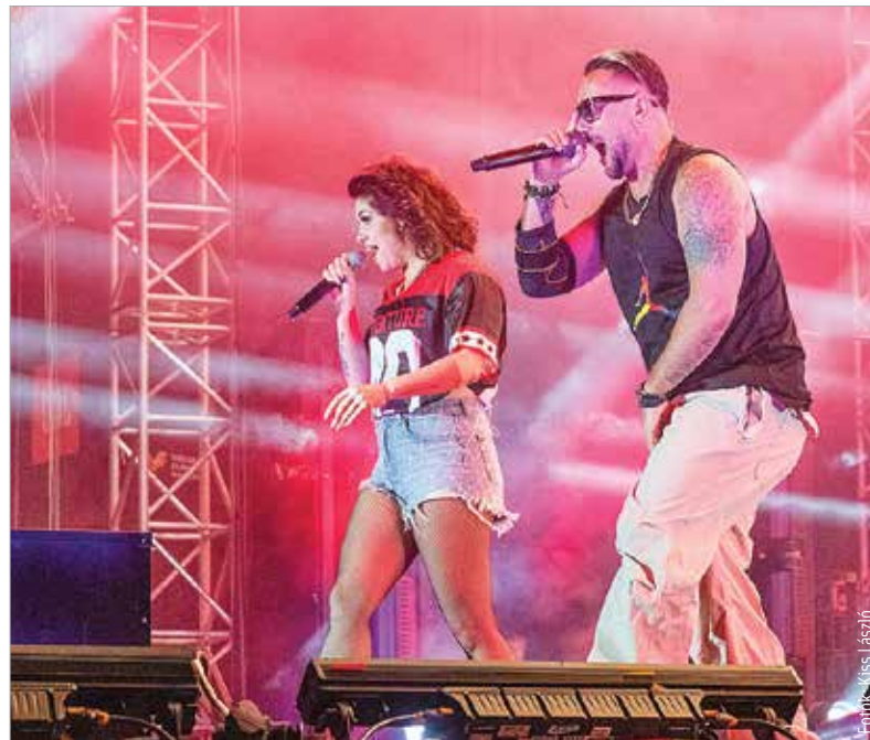
A szombati zárónapon olyan fesztiválkedvencek léptek fel, mint Dzsúdló, Majka vagy a Scooter