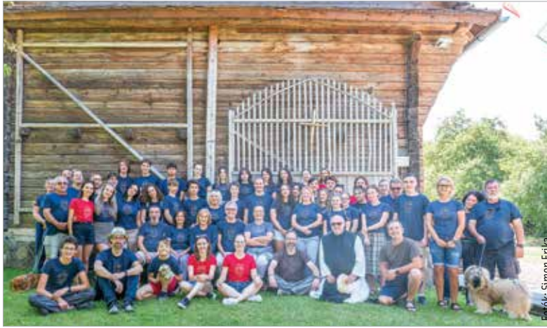
A verstábor közössége idén is sok élménnyel gazdagodott