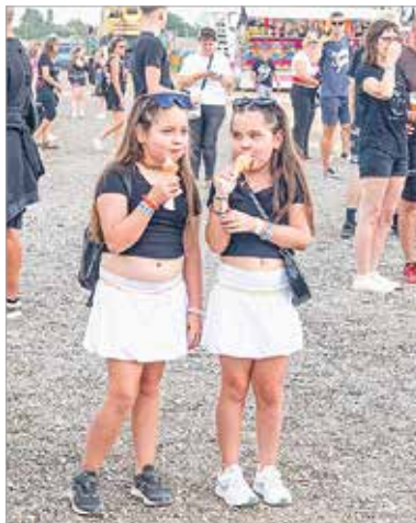
A FEZEN mostanra már mindenkié lett: zene, közösség és család – ez mind belefér a fehérvári fesztiválba