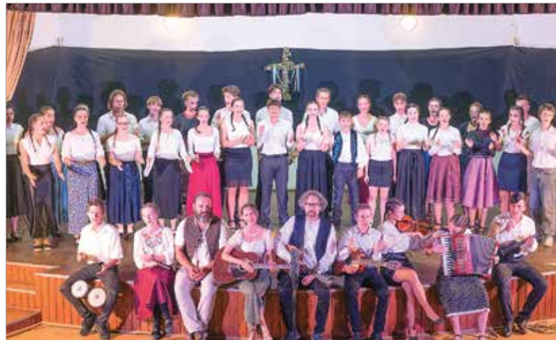
A csomortáni kultúrházban tartott zárógála nagy sikert aratott