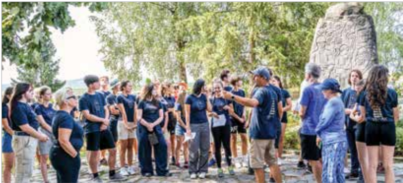
Idén is megemlékeztek a táborozók Tamási Áronról