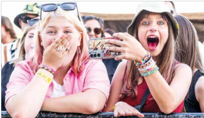
Partihangulat, jó társaság – több tízezer vendéget várnak a négy nap alatt