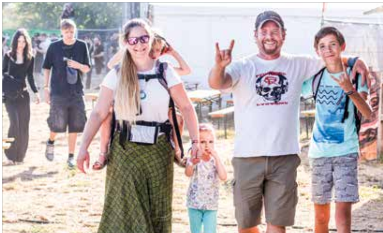
Indulhat a lazulás – akár családosan is!