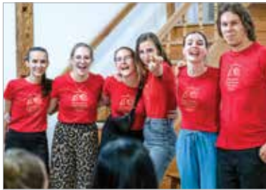
Táborcsinálók: a Fehérvári Versünnepe egykori résztvevői segítenek a verstábor mindennapjaiban

Idén tizenkettedik alkalommal találkoztak a székelyföldi Csíksomortánban a Varga Sándor Verstábor fiataljai. Az idei találkozó jelmondata: „Alattad a föld, fölötted az ég, benned a létra.” A fehérvári önkormányzat a kezdetek óta támogatja a programot, ahol az irodalom és a kultúra iránt érdeklődő fehérvári és határon túli fiatalok, köztük a Fehérvári Versünnepe döntősei merülnek el a versek birodalmában.