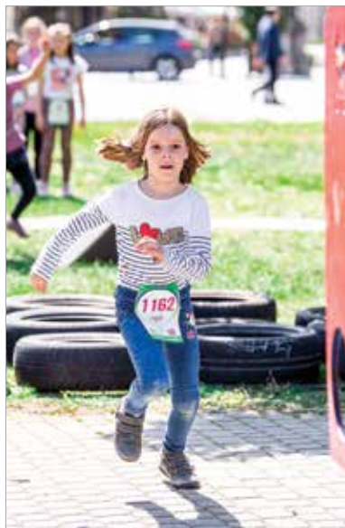
Ügyességi pályák is várták a lelkes fiatalokat

A futás szerelmesei és lelkes szurkolók töltötték meg Fehérvár utcáit vasárnap. Az idei első sportos hétvége igen jól sikerült, több mint nyolcszázán álltak rajthoz a IX. Cserbona Fehérvár Félmaratonon. Szikrázó napsütésben, tapsoló, biztató szavakat kiabáló családtagok és barátok gyűrűjében rótták a város utcáit mindazok, akik részt vettek a minden évben igen népszerű rendezvényen. Már péntektől programok várták a Zichy ligetbe érkezőket, vasárnap délelőtt pedig több távon és kategóriában a futóverseny résztvevői is elrajtoltak.