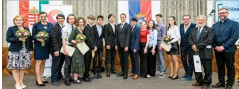
Színpadon a tizenkét döntős és a zsűri