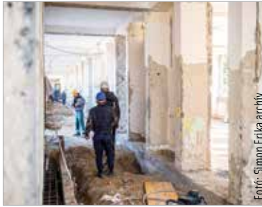
Az iskolafelújítási program jó ütemben halad

A műsorban szóba került, hogy további önkormányzati béreme-