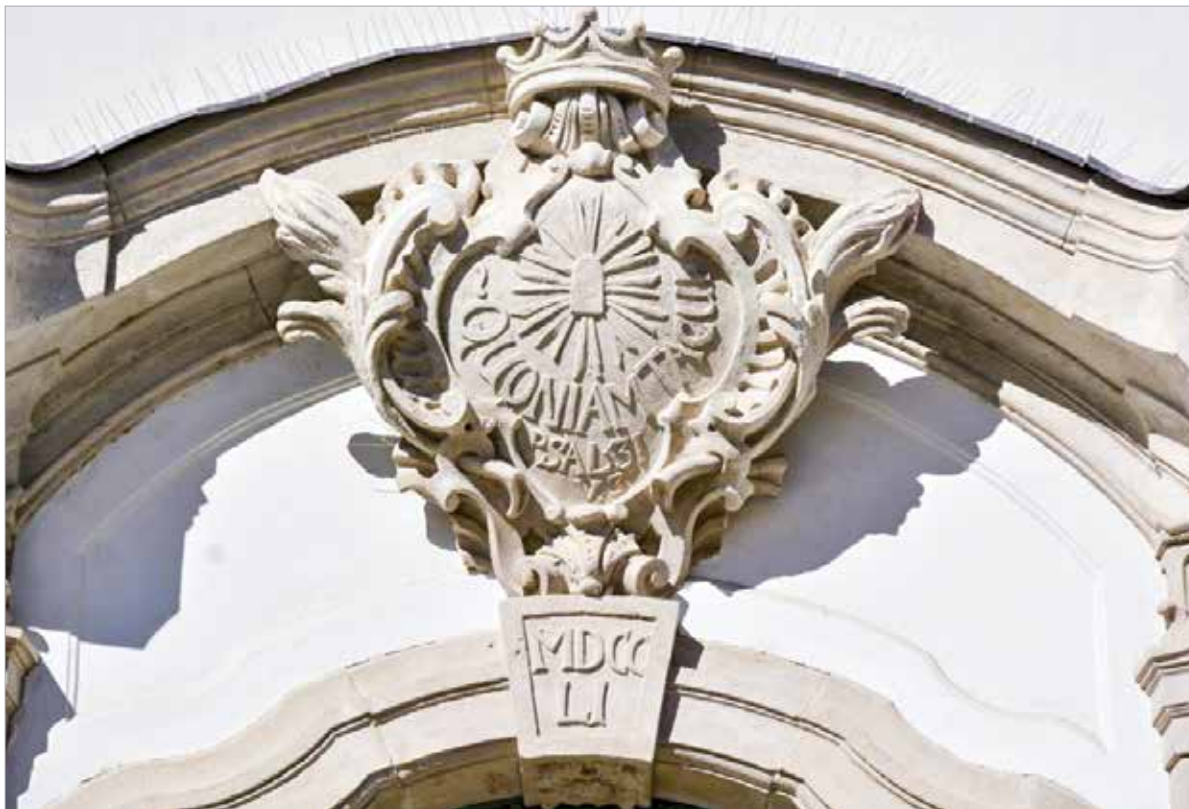
A fehérvári vallási helyek egyik legszebb kapucímere a belvárosi templomot díszíti

A templom története tehát nem nélkülözte a fordulatokat, az állandóságot azonban csodaszép belsője mellett a fehérvári vallási helyek egyik legszebb kapucímere adja. A köztérkép így mutatja be azt: „A kőkeretes kapu barokkosan hajló ívének zárkövében a római évszám (MDCCLI) az építés befejezésére utal, a szemöldökmezőben a templom védőszentjének sugárkoszorúval körülvevett nyelvéreklyéje látható, alatta a latin nyelvű felirat egy zsoltár első két szava, illetve annak száma: „QUONIAM TACUI. PSAL. 31. V. 3.” (Hallgass meg. Zsolt. 31. V. 3.). A kovácsoltvas kapuszárnyak felett pedig a jezsuita címer látható.”