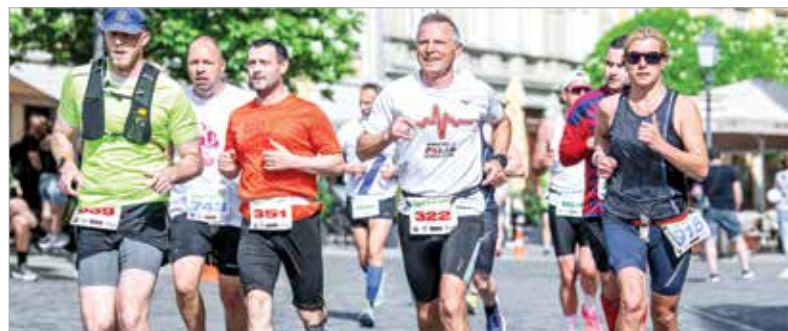
A városi sportprogramokban immár hagyományos, visszatérő rendezvénynek számító Cserbona Fehérvár Félmaraton indulói vasárnap tízkor rajtoltak a Zichy ligettől, és a történelmi belvárosban kijelölt pályán futottak