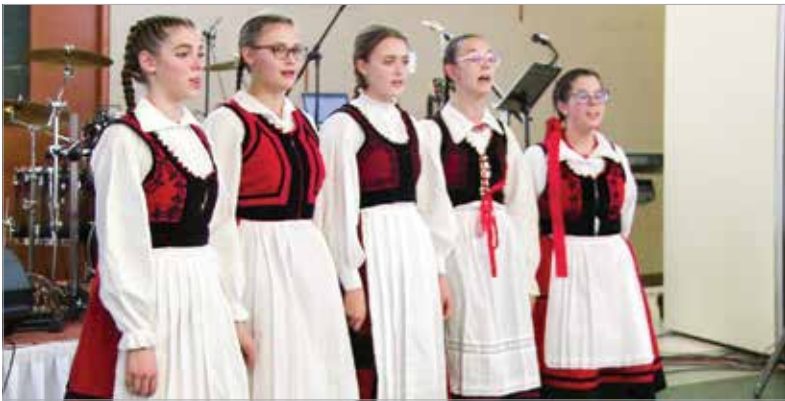
A székely kultúra kapta a főszerepet április tizenharmadikán, szombaton a Magyar Király Szállóban. Az esemény ezúttal is jó célt szolgált, hiszen a bevételből Móralfalvát, illetve a Kárpáti Igaz Szó című hetilapot támogatják.