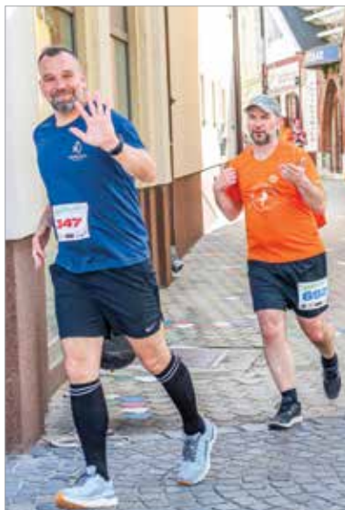
Családok, baráti csapatok is teljesítették a távot