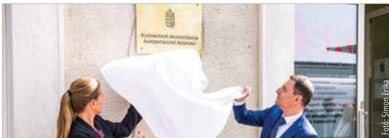
Az Áldozatsegítő Központ könnyen megközelíthető helyen, a Piac téren, a Megyeház közsarkán kapott helyet

A székesfehérvári központ kialakítására ötvenhétmillió forintot fordított a kormány. Az igazságügyi miniszter, Tuzson Bence az átadónapszéken kiemelte: a központok működtetése a kormány családpolitikájával együtt mintaként szolgál az Európa Tanácsban és az unióban egyaránt. A székesfehérvári központban egy koordinátor, két ügyintéző és egy pszichológus dolgozik azért, hogy a segítségre szoruló áldozatoknak hatékony támogatást nyújthassanak. A sértettek jogi tanácsadásért, valamint anyagi és mentális támogatásért fordulhatnak a szolgálathoz. A bűncselekmények sértettjei krízis esetén az éjjel-nappal hívható 80 225 225-ös telefonszámon is segítséget kérhetnek.