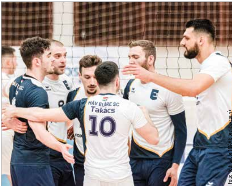
Kaposváron nagyt küzdött, de pénteken már nyerni is szeretne a fehérvári röplabdacsapat