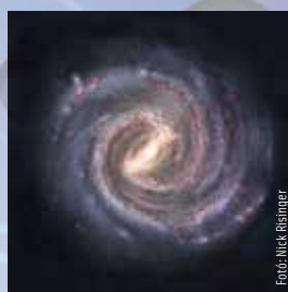
2024. február 22-28.

Barátságban vagy a számokkal, de ez sajnos nem az anyagi bőséget jelenti. Mostanában egyre több olyan emberrel találkozol, akik feleslegesen fecsegnek, és nem eléggé fontolják meg a mondandójukat. Ha az ilyen helyzeteken bosszankodsz, azsal csak öngólt rúgsz magadnak.