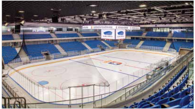
Az Alba Aréna állami támogatásból épült, üzemeltetését a Székesfehérvári Városfejlesztési Kft. és a Városgondnokság végzi

nát. A csapatok másnap újra jégre lépnek, így a közönség rögtön két alkalommal láthatja az A csoportos világbajnoki mezőny tagját. A jegyvásárlás e héten pénteken és szombaton, az Alba Aréna nyílt napjain indul. A szurkolók itt személyesen válthatják meg a belépőket, valamint egy bejárás keretében megismerkedhetnek az aréna olyan részeivel, melyeket később nem láthatnak, így például a játékosok öltözőjével is. A vadonatúj létesítmény konferenciatermében rendezett sajtótájékoztatót Cser-Palkovics András