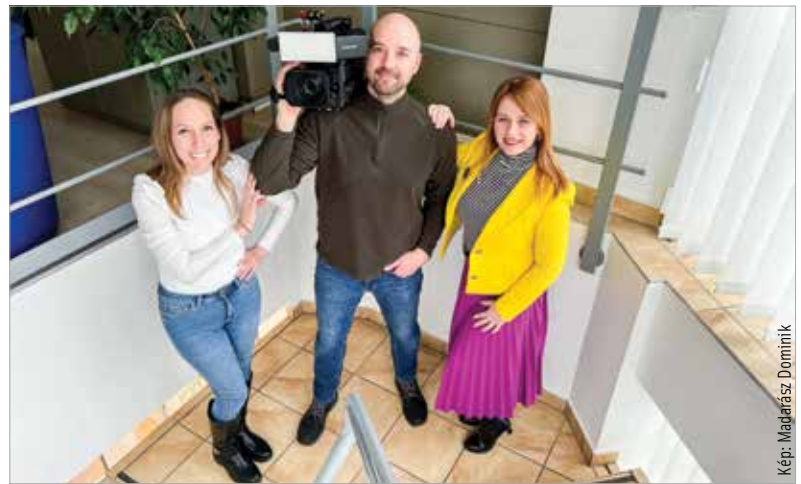
A magazinműsor stábjának hangulatos esküvői miliőbe invitálja a nézőket tizenkét részen keresztül