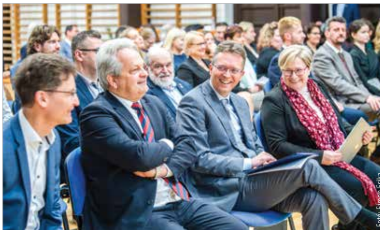
A beruházás nyitóeseményén négy fehérvári szakképző iskola felújítását jelentették be