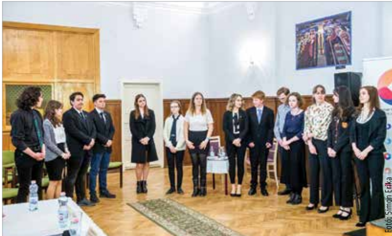
Tavaly a huszonhat induló diák közül tizenketten jutottak tovább a döntőbe a zsűri értékelése alapján

középiskolák oktatási intézményének tanulóival, de székesfehérvári állandó lakhellyel rendelkeznek. A zsűri elnöke ezúttal is Kubik Anna színművész. A Fehérvári Versünnepet 2010-ben hívta életre a Fehérvár Média centrum, amit azóta is a Székesfehérvári Egyházmegyével, Székesfehérvár önkormányzatával, a Szent István Hitoktatási és Művelődési Házal, valamint a Vörösmarty Színházzal együttműködve szervezik meg.