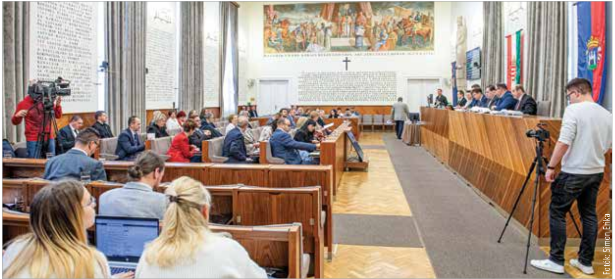
Stabil költségvetés, jelentős tartalékok

Tizenhét igen szavazattal fogadta el a város közgyűlése a 2024-es költségvetést. Több mint kilencvenmilliárd forint sorsáról döntött a testület egy korrekt vitát követően – összegezte a történeteket Cser-Palkovics András polgármester, aki kérdésünkre elmondta, hogy stabil és óvatosan optimista az idei költségvetés. A városi élet legtöbb területén előrébb lehet lépni, továbbra is adósságok nélkül, jelentős tartalékokkal: „Éz egy stabil, biztonságos működést és komoly fejlesztéseket, illetve béremelést tartalmazó költségvetés, továbbra is adósság és hitel nélkül. Ez azt jelenti, hogy nem kell felvennünk az idei esztendőben – sem éven belüli, sem éven túli – hitelt működésre vagy fejlesztésre.” Kilencmilliárdos tartalékok is betervezték, amiből hárommilliárd forint szabad pénzügyi forrás, amit bármire fordíthat a város. A béremelés kapcsán a polgármester elmondta, hogy egymilliárdos