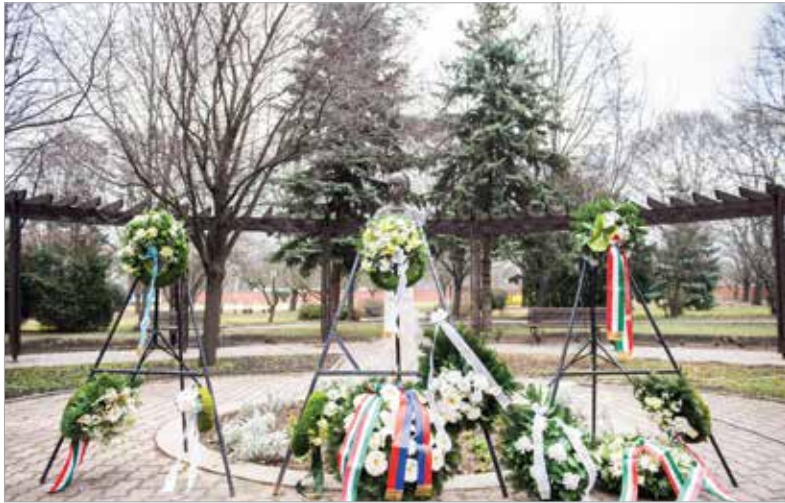
Koszorúk Kossuth Zsuzsanna szobra előtt

Magyarország első főápolója emléke előtt. A rendezvényen részt vettek a kórház vezetői és dolgozói, valamint a város és az önkormányzat képviselői. A Magyar Országgyűlés 2014-ben nyilvánította február 19-ét, Kossuth Zsuzsanna születésnapját a magyar ápolók napjává. Nyakas Eszter, a kórház ápolási igazgatója beszédében az ő élettörténetét idézte fel, kiemelve,