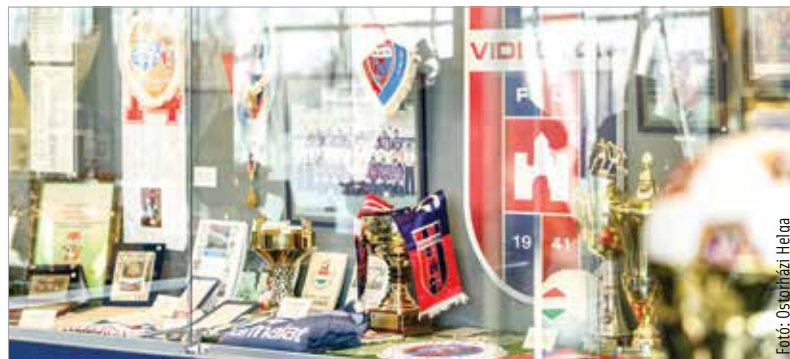
Relikviák a vitrinekben

A jövőben számos programot terveznek a helyszínen, azaz a Sóstói Stadionban megrendezni, például csocsó- és kommentátorbajnokságra, nyári táborokra is számíthatnak az érdeklődők. Kiemelten készülnek továbbá a 1984-es UEFA-kupa-menetelés negyvenedik évfordulójának megünneplésére. Folytatódnak a stadiontúrák, ezekbe minden esetben beletartozik majd a múzeumi körbevezetés is. A múzeum innentől állandó nyitvatartással, keddtől szombatig lesz látogatható, ami azt is jelenti, hogy a múzeumba ezentúl jegyet és bérletet is válthatnak a szurkolók, akár a mérkőzések előtti órákban is, hiszen akkor is várják majd az érdeklődőket.