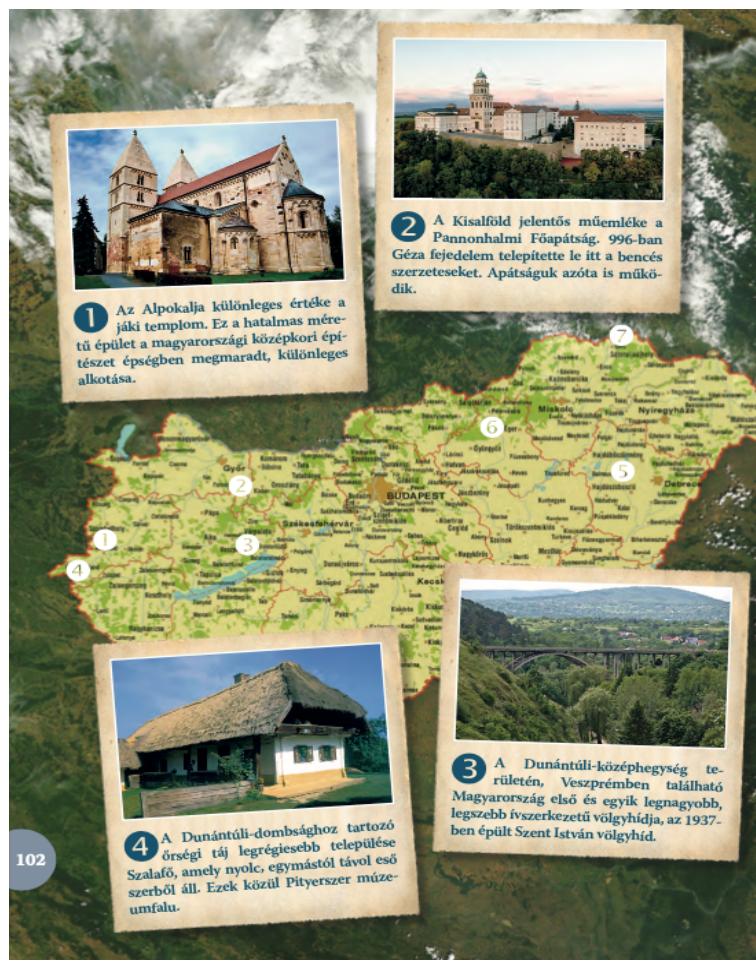
2. ábra: Nagytájak és az épített örökségek Figure 2. Large landscapes and built heritage