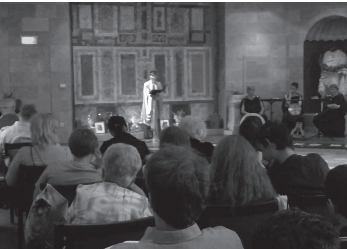
A költőverseny döntőbe jutott műveinek előadása, kísér a Trigonon együttes