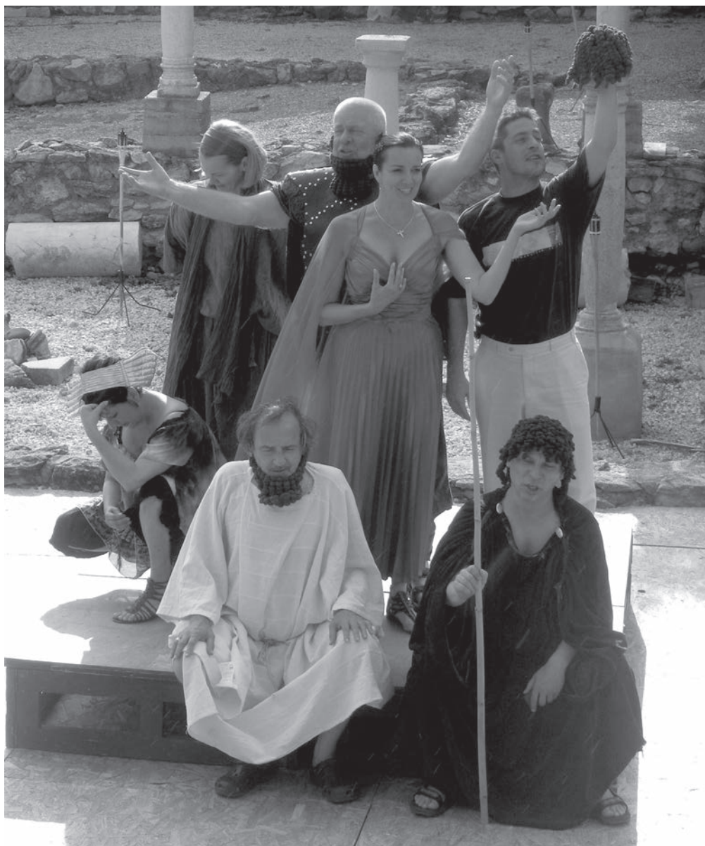
Részlet az Amphitrüon 2010 főpróbájáról