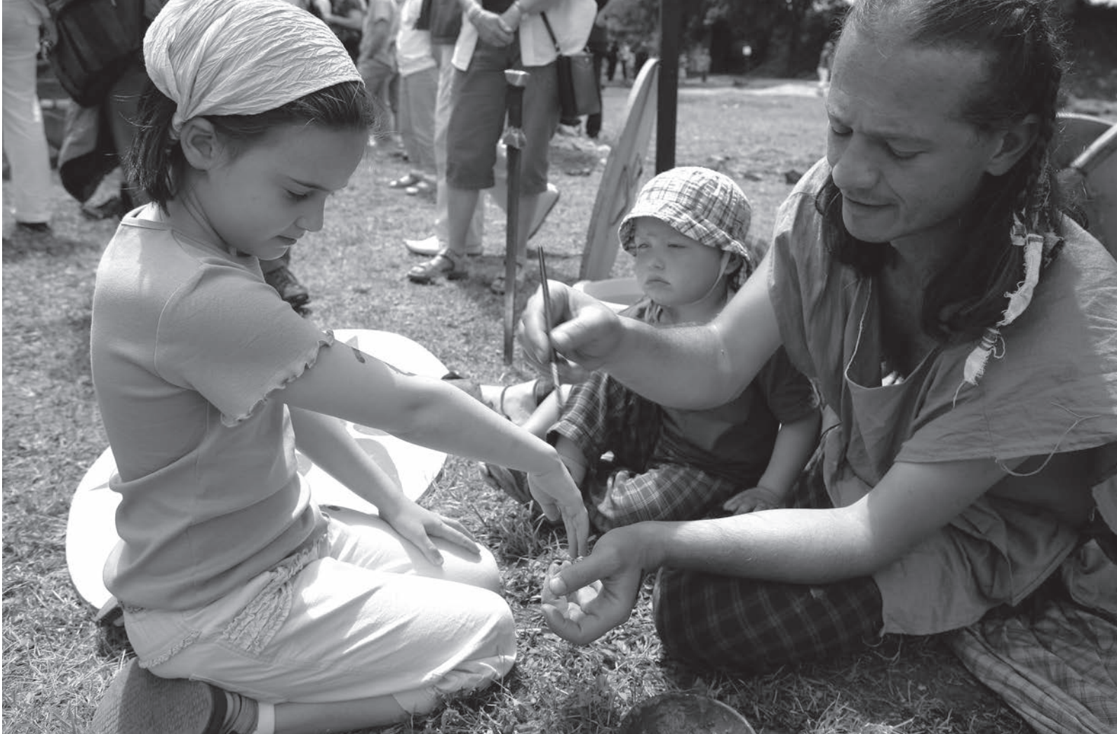
Testfestés a kelta Teut-Os Szarvas Törzs táborában

pontján elhelyezett kézművesekkel találkozhattak, akik bemutatták és átadták tudásukat az érdeklődőknek. Mindkét nap folyamatosan látogathatók voltak a kelta és római hagyományőrző csapatok táborai, ahol gladiátorsimogató, gladiátoriskola, fegyverpróbák és bemutatók várták a látogatókat. Szintén a hagyományőrző csapatok közreműködésével valósultak meg a gladiátorviadalok, a római divatbemutató, a római bírósági tárgyalás. Az érdeklődőket kelta jósnő avatta be a jövőjükbe.