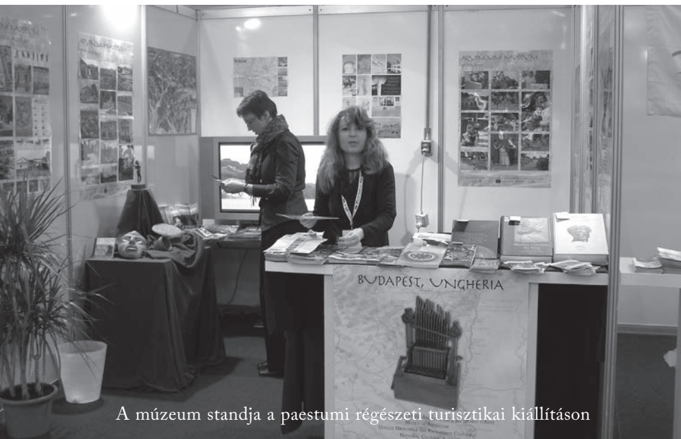
A múzeum standja a paestumi régészeti turisztikai kiállításon