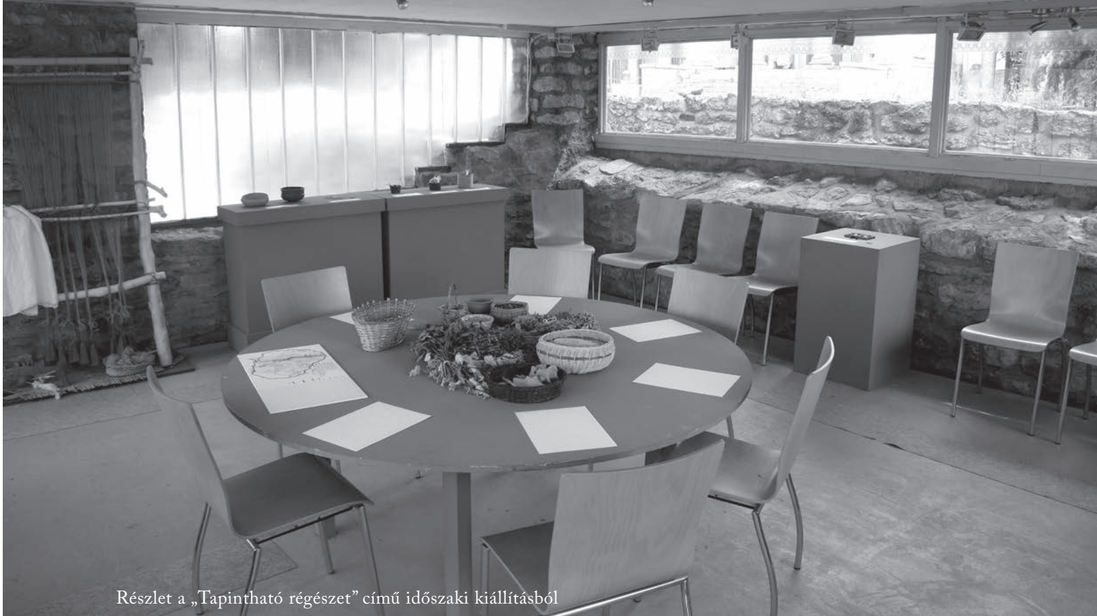
Részlet a „Tapintható régészet” című időszaki kiállításból