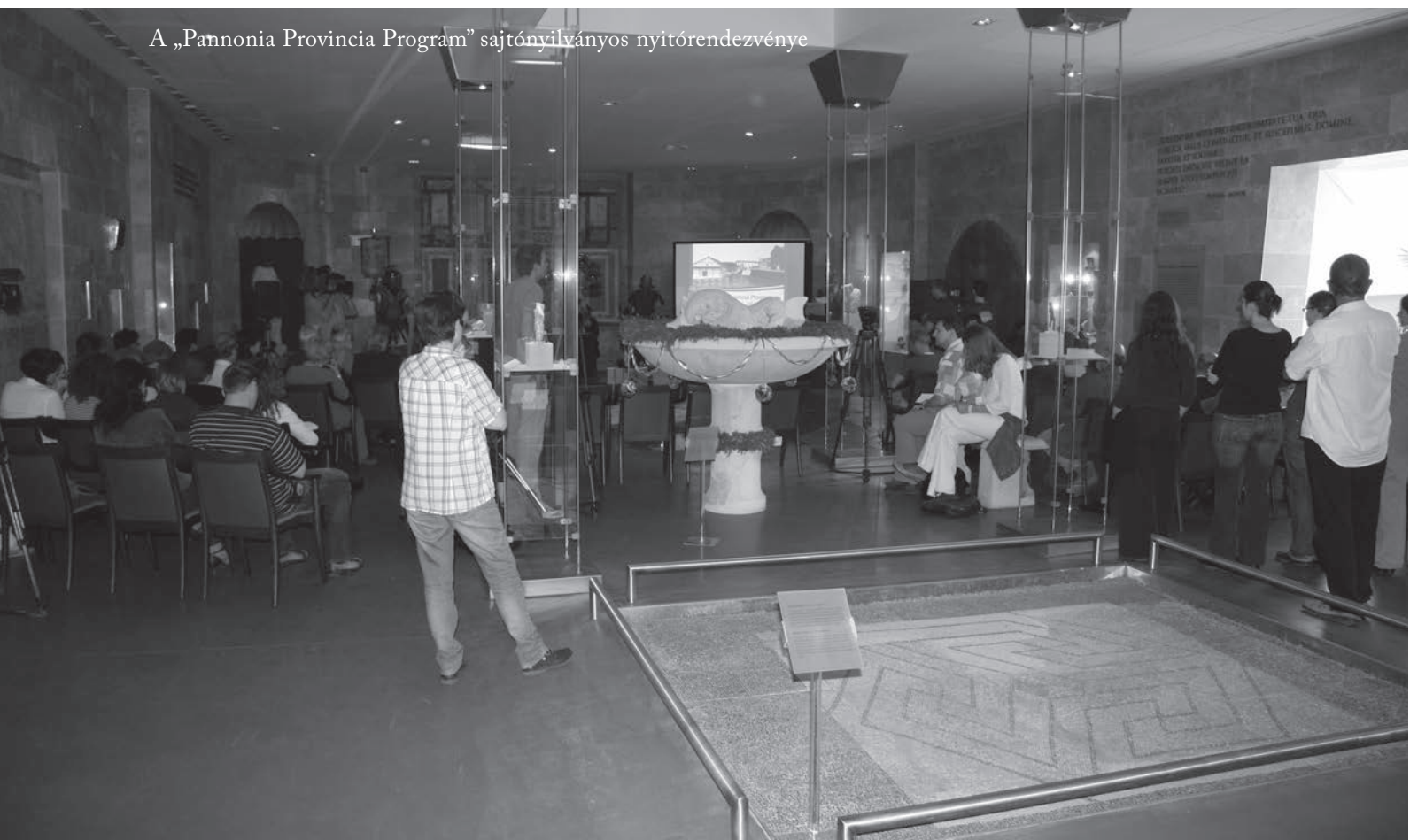
A „Pannonia Provincia Program” sajtónyilvános nyitórendezvénye

jobban igazodó jellegéhez, kevesebb új építéssel, több felújítással, funkcióváltással, környezeti rehabilitációs elemmel és a látogatók által bejárható nagyobb területtel. Ugyanakkor a program – a műemléki környezethez alkalmazkodva – igyekszik nem visszafordíthatatlan változásokat előidézni a területen. A módosított tervezési program körvonalázásához a váratlan szerencse is hozzásegítette a múzeumot. Az új kiállítási épület pincéjében használati joggal rendelkező ELMŰ, megkezdte kiköltözését és szándékai szerint – figyelembe véve a projekt érdekeit – 2011 közepéig átadja a terüle-