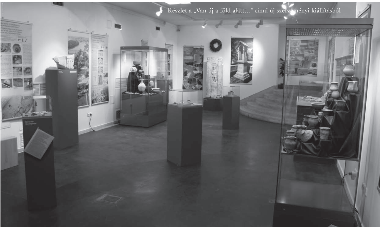
Részlet a „Van új a föld alatt...” című új szerzeményi kiállításból