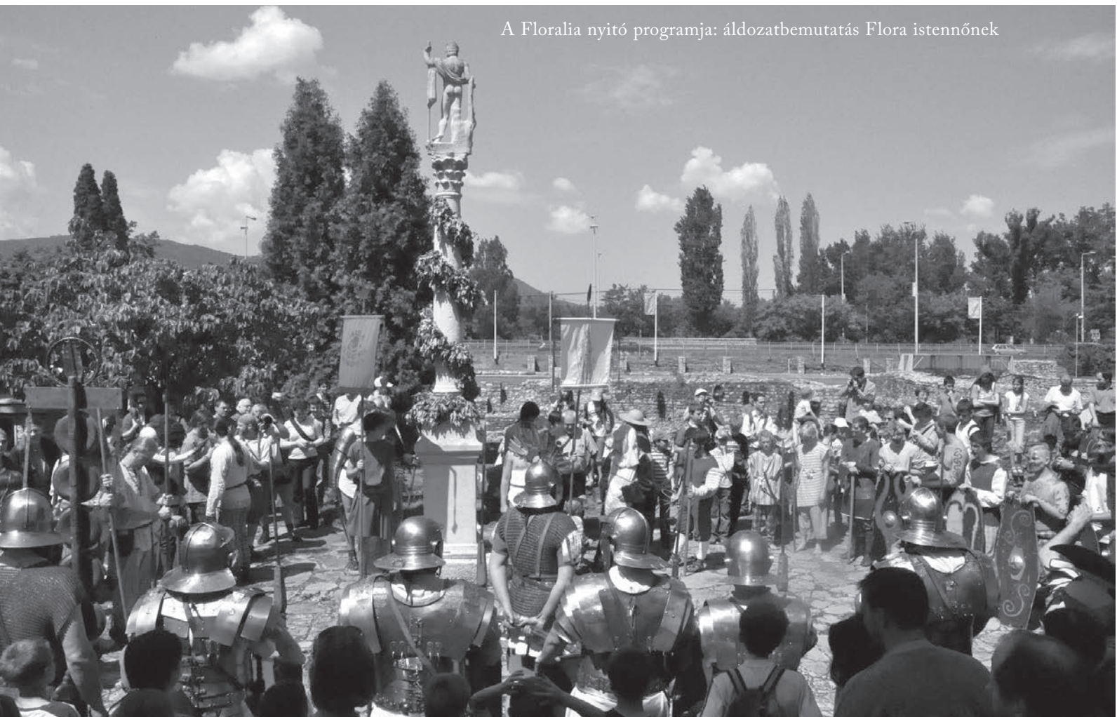
A Floralia nyitó programja: áldozatbemutató Flora istennőnek

A Floralia állandó elemei a 2010. évben sem maradtak el: a rendezvény nyitóprogramját jelentette az áldozatbemutató Flora istennőnek és a kétezer éves Pannonia tiszteletére, amelyet felvonulási menet követett. A látogatók a terület több