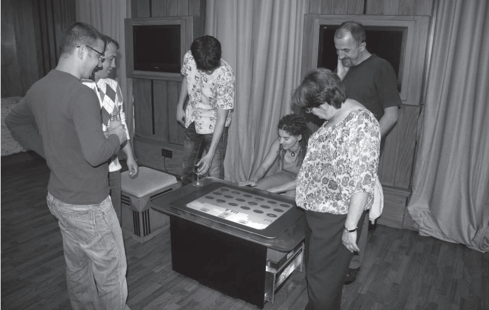
A „Pannonia Provincia Program” keretén belül megvalósuló interaktív játéktér egyik eszközének bemutatása

tet az intézménynek. Ezzel a gesztussal vált lehetővé az új építések nagy részének kiváltása. A termódosításra lehetőséget kapott az eredeti terv készítője, azonban a hirdetmény nélküli tárgyalásos közbeszerzési eljárás eredménytelenül végződött.