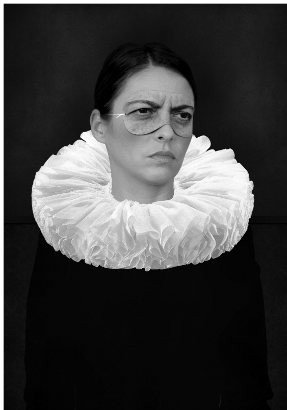
Through her eyes, digitális grafika, 2017

Az alkotások komoly mélységeik ellenére sem merevek vagy tragikusak. A megoldások frappánsága szuggesztív fordulataival kellően animálja ezt a belső teret, és formai játékával végképp feloszlatja a valóságot. Ami belőle marad, az csak az érzés, a helyzet és a pillanat.