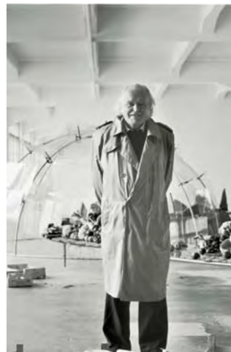
MARIO MERZ SVÁJCBAN, A SCHAFFHAUSENI GYŰJTEMÉNYÉBEN

Több mint 30 darabot állítanak ki a Pirelli hangár hatalmas tereiben. Merz 1968-tól kezdve készített iglukat, számára ez világ-szimbólum volt, s egyben a gyógyító mágia eszköze, mellyel a természet és az ember alkotta világ harmóniáját kívánta újratereíteni – már akkor. A művész mint nomád – írta róla Germano Celant művészettörténész, aki a Mario Merzhez hasonlóan alkotó, a nomád művészettől inspirált művészeket az általa javasolt (és később elterjedt) arte povera irányzatba sorolta. Az iglu mint hajlék archetípus az ember által épített környezet metaforája, Merz szándékosan ütközteti természetből vett elemekkel,