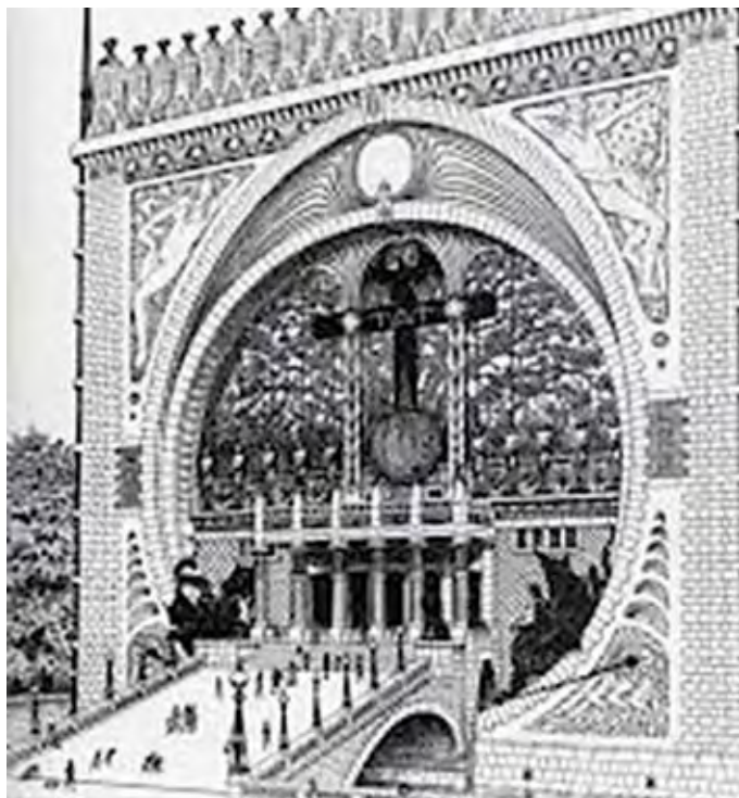
HUGO REINHOLD KARL JOHANN HÖPPENER, MÓVÉSZNEVÉN FIDUS: FÖLDTEMLOM TERVE, 1901