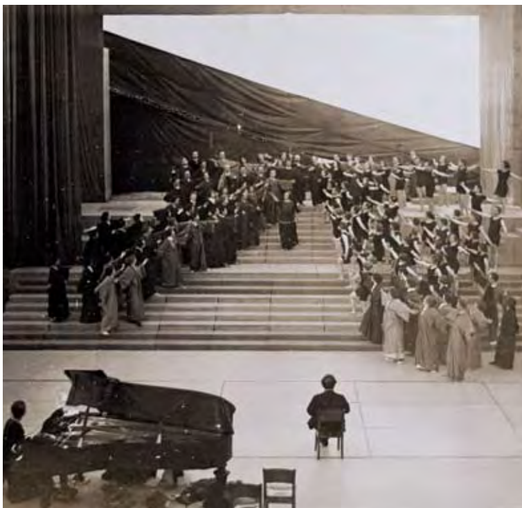
A HELLERAUI FESTSPIELHAUS ADOLPHE APPIA ÁLTAL TERVEZETT SZÍNPADA, 1912