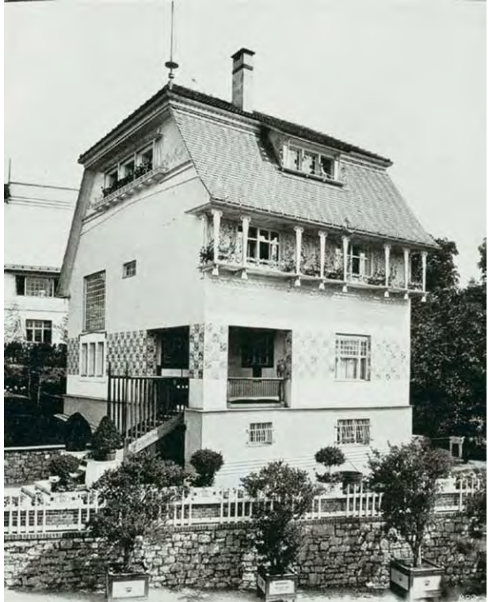
JOSEPH MARIA OLBRICH HÁZA A DARMSTADTI MATHILDENHÖHE MŰVÉSZTELEPEN

gozó kiállítás a korszak jelentős közép-európai és magyar festői – Csontváry Kosztka Tivadar, Aba-Novák Vilmos, Gulácsy Lajos, Mednyánszky László, a gödöllői művésztelép számos alkotója – mellett feltárja az építészet történetének egyik kevésbé közismert vonulatát is. Megidézi az életreform „vándorprófétáinak” archaikus szimbólumokat összegző templomterveit és szakrális építményeit, a svájci Monte Verità művészházait, a Drezda melletti Hellerauban alapított kommuna szá-