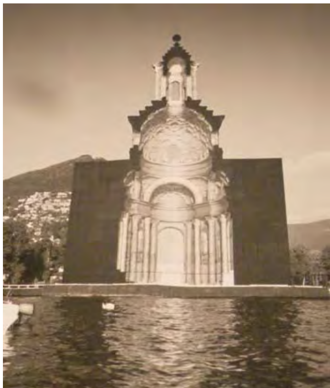
MARIO BOTTA: BORROMINI RÓMAI SAN CARLO ALLE QUATTRO FONTANE TEMPLOMÁNAK MAKETTJE A LUGANÓI-TAVON, 1999