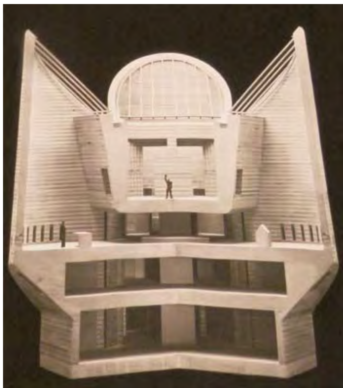
A SVÁJCI TICIÓBAN ÉPÜLT KERESZTELŐ SZENT JÁNOS TEMPLOM MAKETTJE