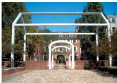
FRANKLIN COURT, PHILADELPHIA, 1976

A kelet-európai rendszerváltásban az irányzat elaprózódott és kritikai hatás helyett a kritika céltáblájává vált. Venturi 93 évesen, 2018. szeptember 20-án hunyt el – ezzel egy korszak lezárult.