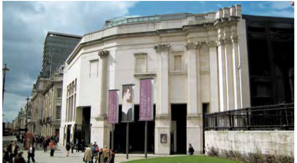
A LONDONI NATIONAL GALLERY BŐVÍTÉSE, 1991

A philadelphiai Guild House (1964) oszlopai, köríves ablakai programépületként fricskázták a modernista építészetet. Ugyanitt az egyik amerikai alapító atya, Benjamin Franklin egykori háza alá telepítette annak múzeumát (1976), felül az épület éleinek