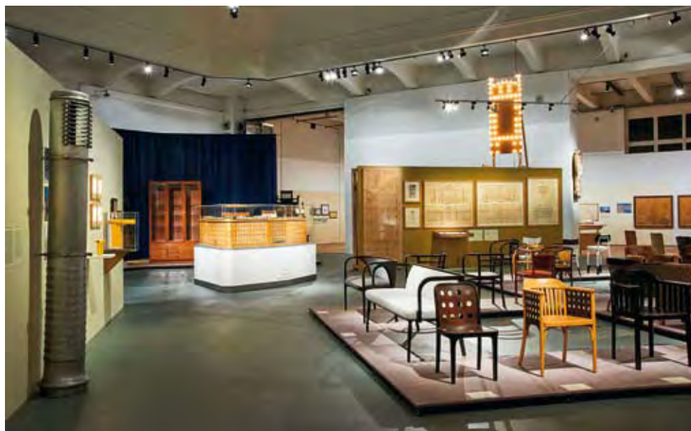
KIÁLLÍTÁSI ENTERIŐR

A cím magyarul is értelmezhető szójátéka mögött egyszerre látványos és tudományosan izgalmas kiállítással társul a bécsi MAK a Wien Museum monografikus bemutatójához (utóbbiról lásd MÉ 2018/3). Mindkét kiállítás apropója a mester halálának 100. évfordulója, de 1918 egyúttal az Osztrák Köztársaság születési éve is, és a Wagner-oeuvre markánsan modern íve jól illeszkedik az új osztrák állam megteremtésének apoteózisával.