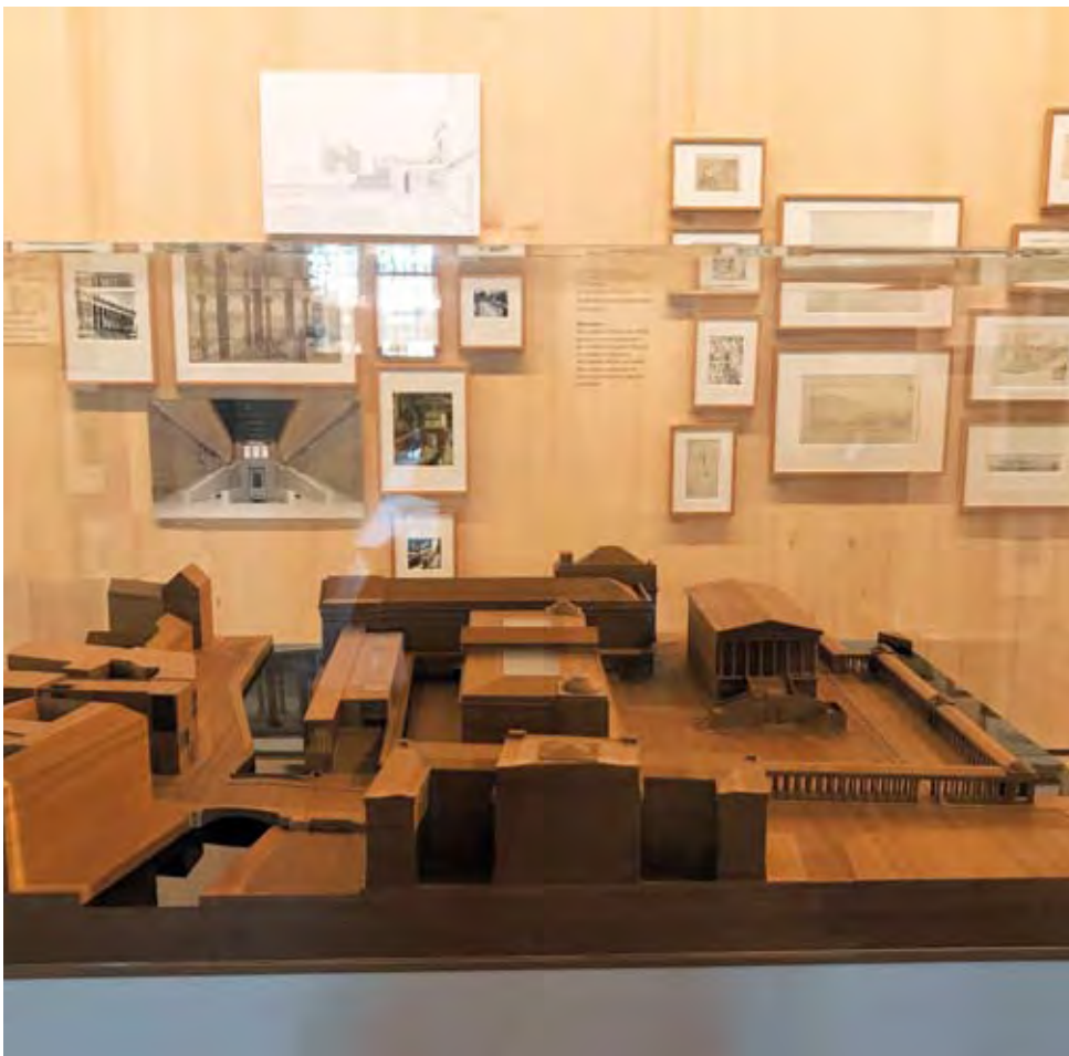
A BERLINI MÚZEUMSZIGET MAKETTJE A NEUES MUSEUM ÉPÜLETÉVEL