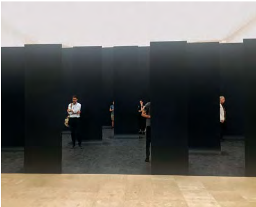
NÉMETORSZÁG PAVILONJA.

A másik pavilonszomszédunk Izrael; a zsidóság hagyományosan a könyv népe. Ők a szabad térhasználatot a Szent Sír templom falait birtokló keresztény egyházak közötti évezredes vita – egy kerámiamodellel van jelen –, illetve a jeruzsálemi Siratófal előtti egykori zsidó óváros kortárs tervezéstörténetének áthallásaival érzékeltetik az emeleti makett-sorban (kurátor: Oren Sagiv). A városrészt (Mughrabi Quarter) az 1967-es háborúban hódították meg, most azoknak az építéseknek az alternatív modelljei töltik ki a pavilon emeletét, akiket annak idején, építészhallgatóként a legtöbbre tartottunk. A történelmi hely szabad terére elképzelt új városnegyedről itthon azóta se sokat hallani. Pedig illusztris az építésznév sor – a kedvenceimet, Louis Kahnt, Moshe Safdit, Superstudiot, Isamu Noguchit említeném itt –, de a nagyhatalmak diktálta tabusítás, a kötelező szolidaritás miatt ezeket a terveket eddig nem kapcsoltuk a freespace fogalmához. Most itt van az összehasonlítást, de kordokumentumot is kínáló izgalmas tezaurusz. 2018-ban mi az országvesztés centenáriuma emlékezünk, Izrael pedig a '68-as építészeti alternatívákkal a 70 évvel ezelőtti, 1948-as államalapítására.