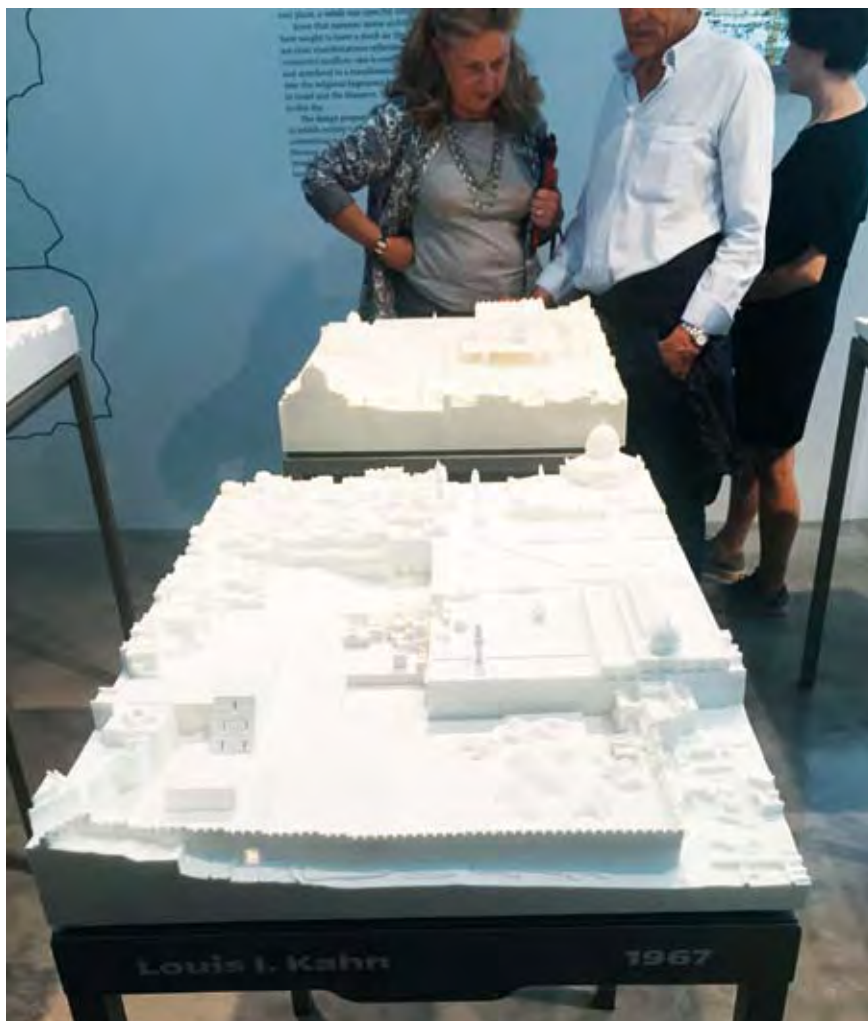
AZ ISZRAELI PAVILION.