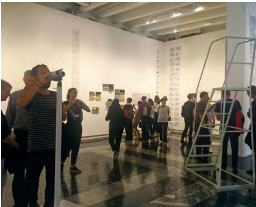
A JAPÁN PAVILON.

A rendre kiemelkedő kiállításokkal jelentkező orosz pavilon ormán vasútállomásokat idéző tipográfiával, a RUSSIA STATION táblájával fogad (kurátor: Semjon Mihailkovski). A pavilon nagyvonalú, friss kiállítási technológiával mutatja be az orosz-szovjet vasúti és városi (metró)állomások megújulását, átalakulását. Az egykor csak passzussal megközelíthető helyek szabaddá válásának építészeti ünnepe látjuk. Hasonló szabadságélményt közvetít – jóval szárazabban, de rendkívül precízen adatoltan – a német kiállítás (kurátorok: Marianna Birther, Lars Kückenberg, Wolfram Patz, Thomas Willemeit). Az 1961-től 1989-ig kettéosztott Berlin egyesülésének urbanisztikai következményeit, a társadalmi vitákat és lokális kuriózumokat egyszerre láttató tablók az NDK előregyártott betonpanel-kerítését formázó installációs elemek hordozzák. Olyan elrendezésben, hogy a néző megéletheti az újra átjárhatóság felszabadító – németeknek biztosan feledhetetlen – élményét.