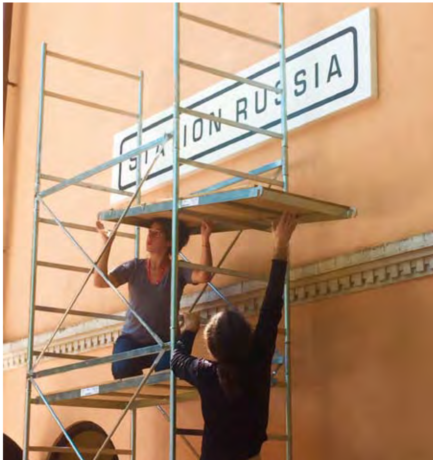
OROSZORSZÁG PAVILIONJA. FOTÓ: SZEGŐ HANNA