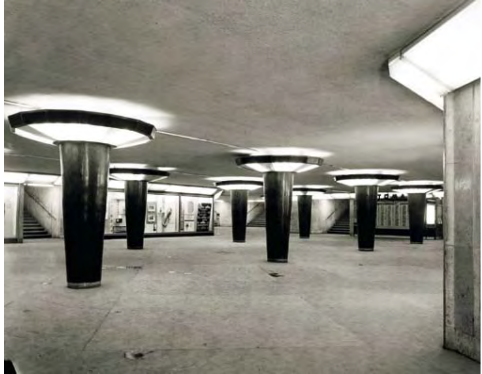
AZ 1963-BAN ÉPÜLT GYALOGOS ALULJÁRÓ A BUDAPESTI ASTORIÁNÁL, 1965

A háborúk és a diktatúrák kora rész az okozati eltérések miatt nehezen kezelhető. A háború utáni Ausztria megkötötte az új (szovjet nélküli) államszerződést, fogadni tudták a