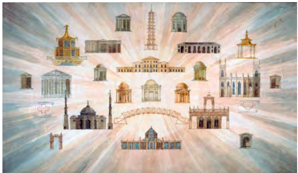
SOANE MÚTERME: A LONDONI KEW GARDENS ÉPÜLETEI