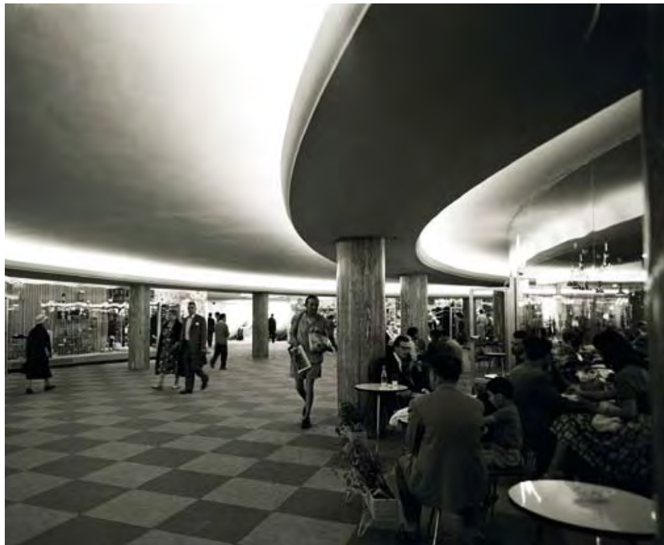
AZ 1955-BEN MEGNYITOTT GYALOGOS ALULJÁRÓ A BÉCSI OPERÁNÁL, 1959

Marshall segélyt, míg Budapestet 1956-ban másodszor is romboltak a megszállók. A város és múltja fejezet fotóanyagából kitűnik, hogy az újjáépítésben „minél radikálisabban jelent meg az urbanisztikai léptékű tervezés, párhuzamosan annál erősebb igényként jelentkezett a történeti városképek védelme” – írja Tamáska Máté a szép katalógusban.