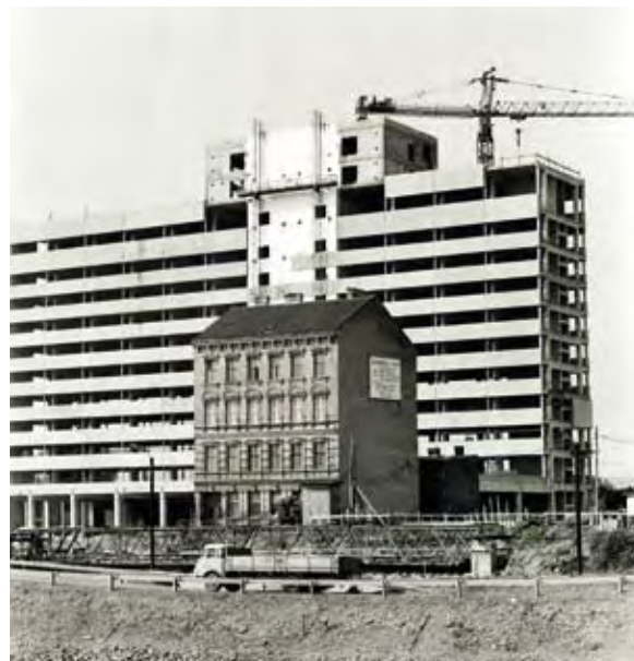
A BÉCSI "ERDBERGERLÄNDE" ÁTALAKULÁSA A DUNA-CSATORNA FELŐL NÉZVE, 1972