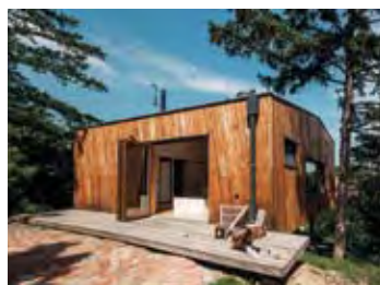
NYARALÓ, MINUSPLUS IRODA.