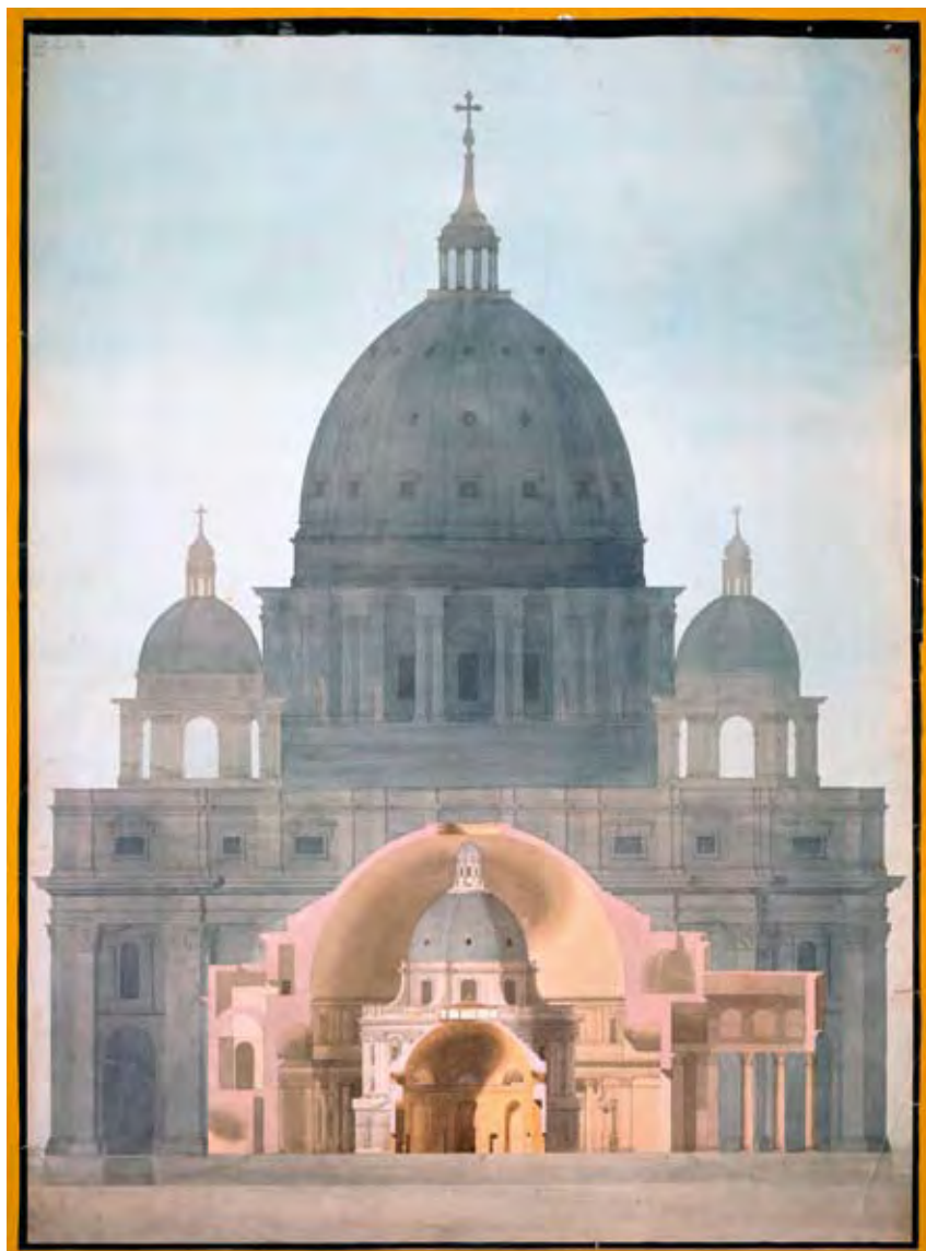
CHARLES TYRELL: A RÓMAI SZENT PÉTER-BAZILIKA ÉS A PANTHEON, AZ OXFORDI RADCLIFFE LIBRARY ÉS SOANE LONDONI ROTUNDÁJA EGYMÁSRA KOMPONÁLVA, 1814

Több mint 1000 rajzot készített vagy készíttetett a 11 év során, a legtöbbet a hallgatók közreműködésével. Némelyik részleteivel hetekig elbábelődtek a diákjai. Ez a kemény munka egyfajta beavatás volt, rengeteg időt, állhatatosságot és a részletek teljes megértését követelte a leendő építészeketől. Többek között ez a sorozat vitte Soane-t arra az elhatározásra, hogy londoni otthonából lakásmúzeumot hozzon létre, melyet amolyan „építészeti akadémiának” szánt, ahol a szakmabeliek és a laikusok különböző szinteken ismerkedhetnek meg az építészet művészetével.