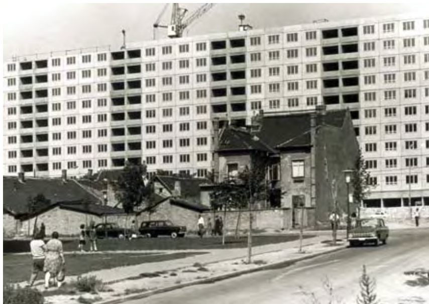
ÚJ ÉPÍTÉSŰ ÉS LEBONTÁSRA VÁRÓ HÁZAK BUDAPESTEN, 1970

Ez utóbbi részlet már a 2. nagy témához is tartozik, amit Sebesség néven foglaltak össze. Tamáska tömören fogalmaz: a 19. században a közlekedés fejlődése megmaradt a házak által közrefogott térben, míg a 20. században a közlekedés terjeszkedő struktúrái köré épültek a házak. A régi újjáépítése helyett egyre inkább az utópiák érvényesülnek, gyakran formai alapon. Például a köztereket a villamosfordulók generálták, de a budapesti Pasaréti tér beépítésénél a buszvégállomást az autóbuszok kisebb fordulóugara helyett a divat diktálta.