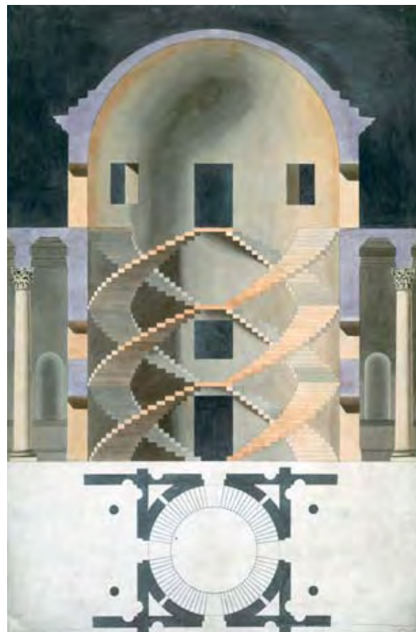
CHARLES PAPENDIEK: PALLADIO CSIGALÉPCSŐ TERVE, 1819

A kézirajz kora leáldozóban van, az építészkörök oktatási módszerei között ma már a 3D modellezés, a parametrikus tervezés