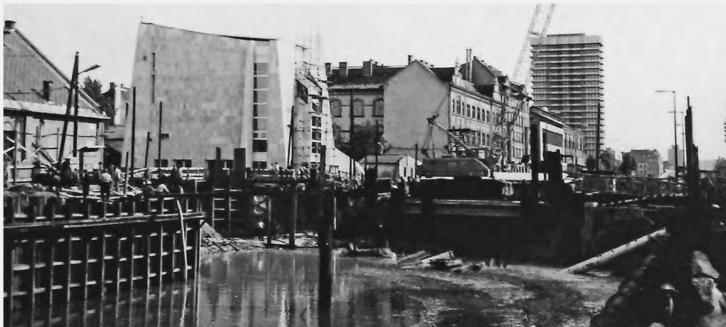
A TEMPLOM ÉS A METRÓÁLLOMÁS EGYIDEJŰ ÉPÍTÉSE, ARCHIV FOTÓ

kon is szerepet vállalt. Bíró Imrét 1972-ben helyezték át Farkasrétre vezető lelkésznek. Békepap volt, az Országos Béketanácsa Katolikus Bizottságának titkára, 1975. június 15. és 1990. március 16. között országgyűlési képviselő, majd később az Elnöki Tanácsa tagja, Kádár János gyóntatója. 2