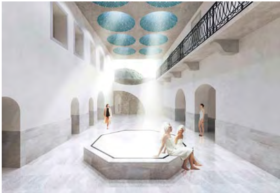
1. DÚJ: 3H ÉPÍTÉSZIRODA KFT.

A Király Gyógyfürdő az egyetlen olyan, nemzetközi jelentőségű, napjainkban is üzemeltetett fürdő a fővárosban, melyet Buda török megszállása idején építettek. Vízellátása az építéskor és jelenleg is a Szent Lukács gyógyfürdő térségében feltárt hévvízes kutakból történt. Az épületegyüttes ókori rétegekre épült, három karakteres periódusban érte el mai formáját (török kor, barokk kor, klasszicista), 1956-ban régészeti feltárások történtek a helyreállítás előtt, ami alapjául szolgált a későbbi helyreállításoknak. A tudományos kutatásokra alapozott, és dokumentált, hosz-