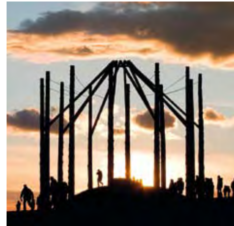
HÁROMSZÉK LÁRMAFA-EMLEKMŰ, 2007. TERVEZŐ: ZAKARIÁS ATTILA

– On our national holiday, March 15th several state and professional recognitions were awarded. Of the individuals receiving these recognitions this year we are hereby focussing on those whose activities are associated with architecture, the artificial environment or the associated arts of architecture.