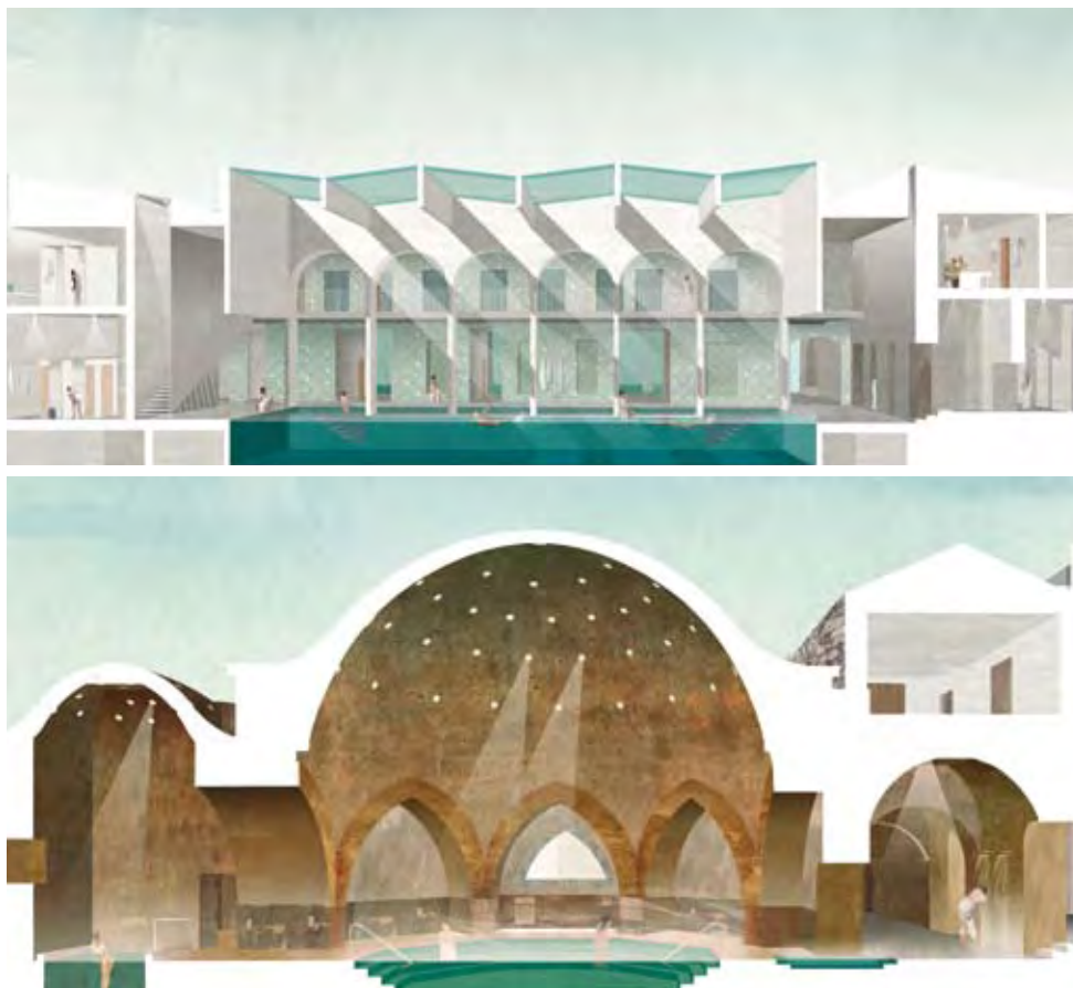
3. DÍJ: GEREBEN MARIÁN ÉPÍTÉSZEK KFT.

A történeti együttest kiegészítve teljesen beépíti a telek délnyugati negyedét és a török fürdőhöz kapcsolódó, fallal határolt kertet