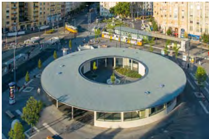
GOMBA, BUDAPEST, 2014. TERVEZTE: SZABÓ LEVENTE, GYÜRE ZSOLT. FOTÓ: SZENTIRMAI TAMÁS