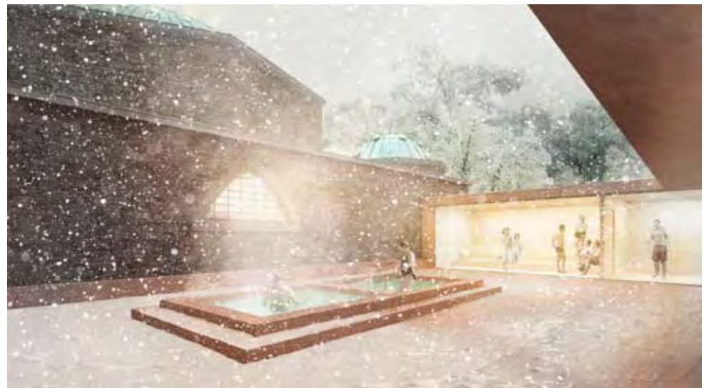
2. DÍJ: ARCHIKON KFT.

szű évtizedek alatt felújított épület, a forráshiányok miatt mindig csak részleteiben volt képes megújulni és megoldani az aktuálisan felmerülő problémákat. A beérkezett pályaművek jelentős száma bizonyítja, hogy jelen ötletpályázatra alapulva aktuális és szükséges egy teljes épületegyüttesre kiterjedő komplex rekonstrukció, nívós helyreállítás és bővítés.