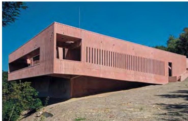
RUDAPITHECUS LÁTVÁNYTÁR, RUDABÁNYA. TERVEZTE: VASÁROS ZSOLT