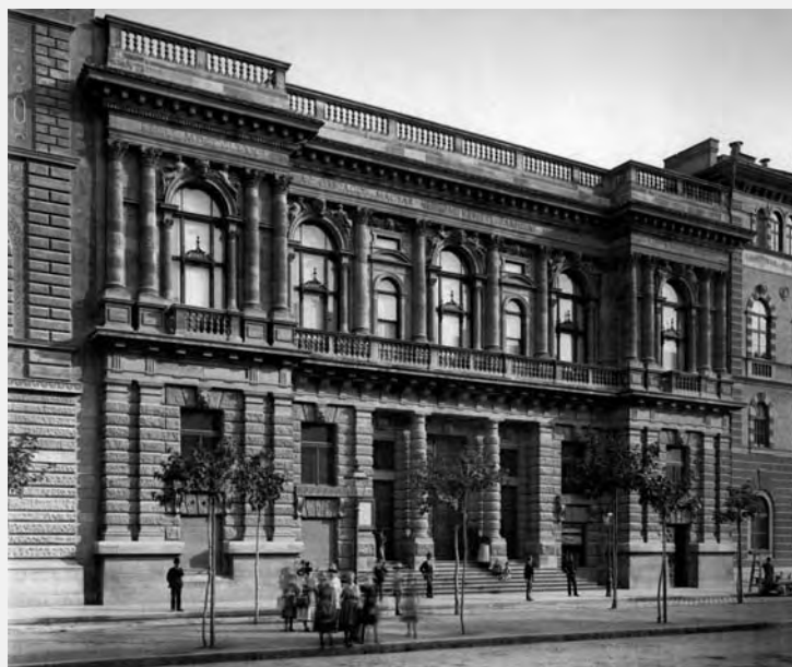
A LANG ADOLF TERVEZTE RÉGI MÚCSARNOK ÉPÜLETE 1890-BEN. FSZEK BUDAPEST GYŰJTEMÉNY

Pilkhoffer elsőként a budapesti Régi Múcsarnokról ír, mely Lang főművének mondható. Ezt követi a szomszédos Régi Zeneakadémia, melyet a Képzőművészeti Társulat építtetett. Pilkhoffer – részben Jakab Dezsőre támaszkodva – felfedez olyan értékeket az épület exteriőrjén, melyeket más kutatók eddig nem vettek figyelembe. Ezután a Pesti Építőtársaság megbízásából emelt épületekről olvashatunk. Két Bajcsy-Zsilinszky úti épületegyüttes bemutatását az Andrassy út páratlan oldala első, városképileg nagy jelentőségű palotájának ismertetése követi. Ez az egyik legkorábbi barokkizáló lakóház Magyarországon, a szerző szerint szinte úttörő jelleggel. Piatsek Gyula