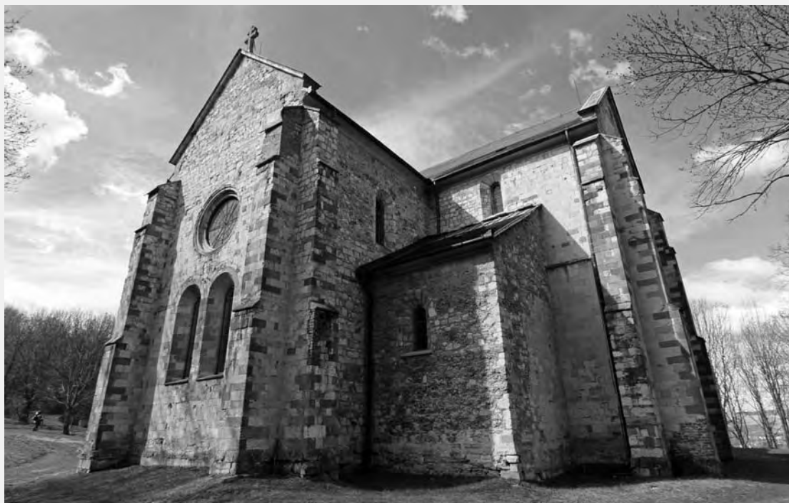
CISZTERCI APÁTSÁGI TEMPLOM, BÉLAPÁTFALVA, 1232 K.

a kereszténységben sem tartott sokáig. A konstantinápolyi Hagia Sophia konstantinápolyi Kr. u. 530 körüli újjáépítése egyértelműen a központi hatalom reprezentációjaként készült el óriási méreteiben. Készítői ötvözték az egykori római paloták és thermák technikáját az ókeresztény építészeti hagyományokkal. Amikor a templom készen lett, Justinianus császár állítólag kijelentette: „Salamon, felülmúltalak téged.” 15 Bár a középkor hatalmas katedrálisai deklarálta Isten dicsőségére épültek, mecénásaik és építető városaik dicsősége legalább olyan fontos volt. Semmiképpen sem véletlen ez a vágy, hiszen a templom, ahogyan minden szent hely, egy szent történetre való emlékezés helye, tehát jó értelemben vett emlékmű. Ezen túlmenően Isten földi lakóhelye, akinek tulajdonképpen otthona maga a világegyetem, ezért a templom a makrokozmosz modellje is.