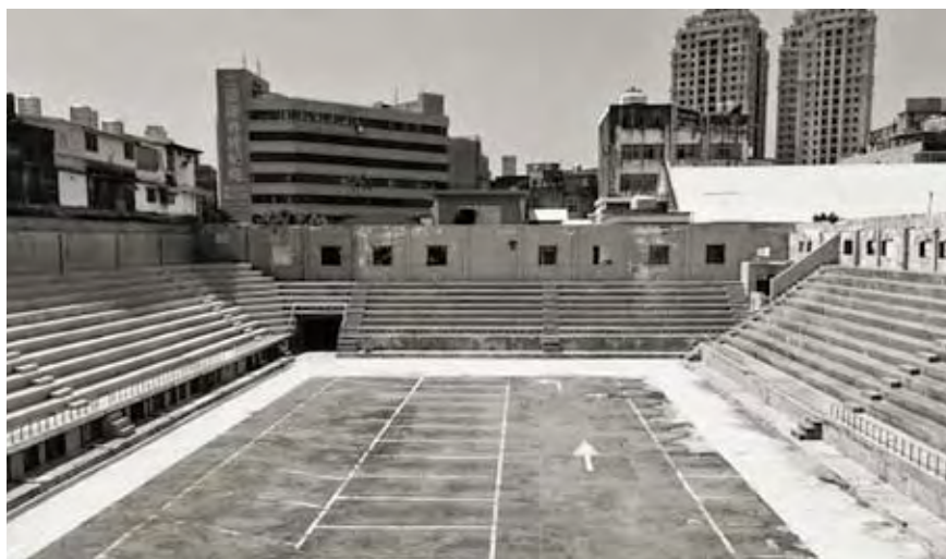
HSINCHU VÁROS RÉGI, HASZNÁLATON KÍVÜLI STADIONJA