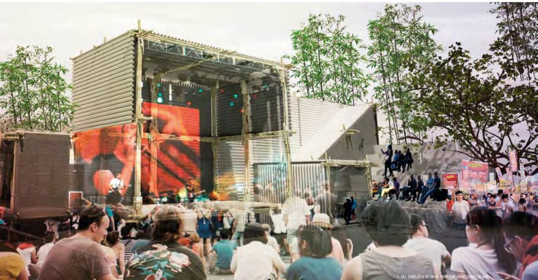
1. DÚJ: ZENÉLÉS A YE-TAI-N, TERV: CHE-HUNG CHIEN (TAJWAN)