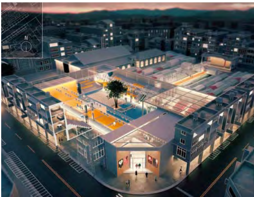
3. DÍJ: TÖRTÉNETEK NYOMÁBAN, TERVEZŐ: YIZHOU LIU (KÍNA)