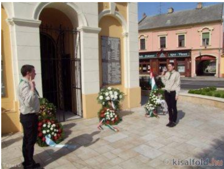
Cserkészek tisztelegnek Mosonmagyaróváron