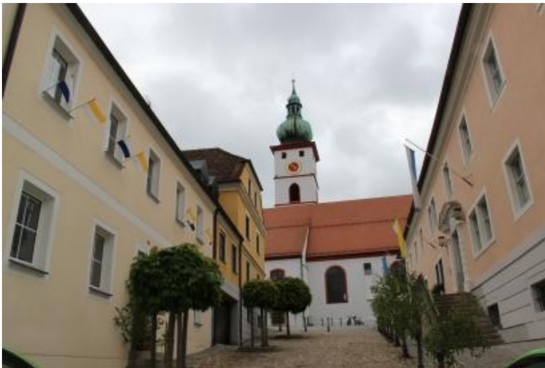
Az Oberpfalz-i (Bajorország) Tirschenreuth temploma, melynek padlása volt a Ludovika zászlaja háború végi menekítésének egyik állomása.