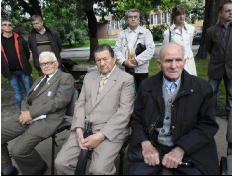
A két doni harcos