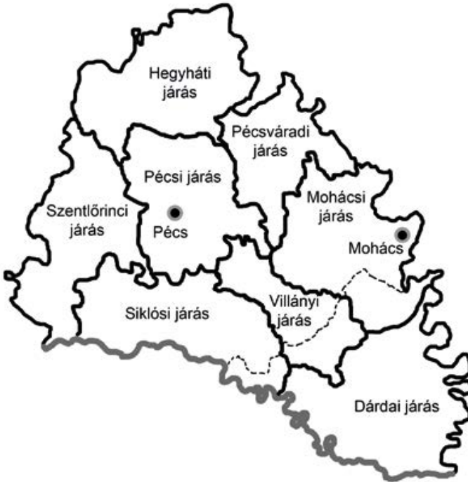
1. térkép. Baranya vármegye járásai 1941 augusztusát követően