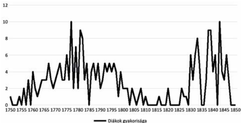
1. ábra. A nagykunsági partikulában végzett diákok időszaki megoszlása 1750-től 1850-ig