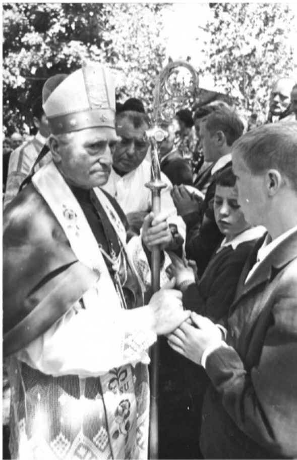
Bérmálás Futásfalván 1972-ben

„Tudjuk, hogy a rendkívüli nehézségek közt rendkívüli kegyelmeit is megadja Isten, és senki hibáján kívül nem fogja nélkülözni a legnehezebb megpróbáltatások közt sem Isten erős segítségét. Legyenek önmaguk is meggyőződve, és híveiket is okos tapintattal győzzék meg róla, hogy közös bátor kitarításunk megerősíti az esetleg ingadozó, gyenge hívőt is; viszont minden egyes katolikus hívő és különösen papnak önfeláldozó, a nehézségektől vissza nem riadó bátorsága és hűsége a közösség javára is van. Tapasztalataink igazolják, hogy mindenütt, ahol az egész közösség és papság megalkuvás nélkül kitarított a katolikus szent hit és egyház mellett, a nehézségek is csökkentek; viszont a gyávaság, a megalkuvás és az önös érdekek keresése fokozta a nehézségeket és veszedelmeket. Az egyház már sok vihart élt át, de mindegyikből megijultan és megerősödve lépett elő. Az istenhit és annak legtisztább formája: a katolikus vallás nemhogy hanyatlóban volna, hanem hathatósabb és diadalmasabb, mint valaha. Erősítsük meg híveink lelkében is ezt a biztonsgátudatot, hogy a mi hitünk letörhetetlen és diadalmasan túlél minden emberi alkotást (1Jn 5,4). Gyulafehérvár, 1948. október 11., a Boldogságos Szent Szűz anyaságának ünnepén, ÁRON püspök.”