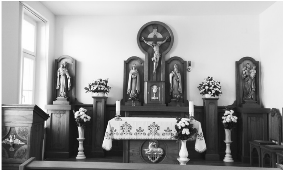
A Karmel Kiskertje Óvoda kápolnája

– A tágas udvarrészekben sokféle gyümölcsfa, virágoskert és veteményeskert ad lehetőséget a különféle tevékenységek, megfigyelések szervezéséhez. Célunk, hogy a gyerekek rácsodálkozzanak a teremtett világra, érezzék a Gondviselő Isten mindenhatóságát és szeretetét. A Mennyei Atya iránt ébredjen a szívében hála. Szeretnénk a gyerekeket ráébreszteni arra, hogy mi, emberek is társai lehetünk Istennek a teremtésben, ha védjük, óvjuk környezetünket, ha szépítjük a világunkat. A kápolna segíti a hitéletre nevelést. Minden hónapban gyermekszentmise keretében énekkel, imával köszöntjük Jézust. Más napokon is felmennek a kápolnába áhítat keretében. A sósoba az egészséges életmódra nevelés