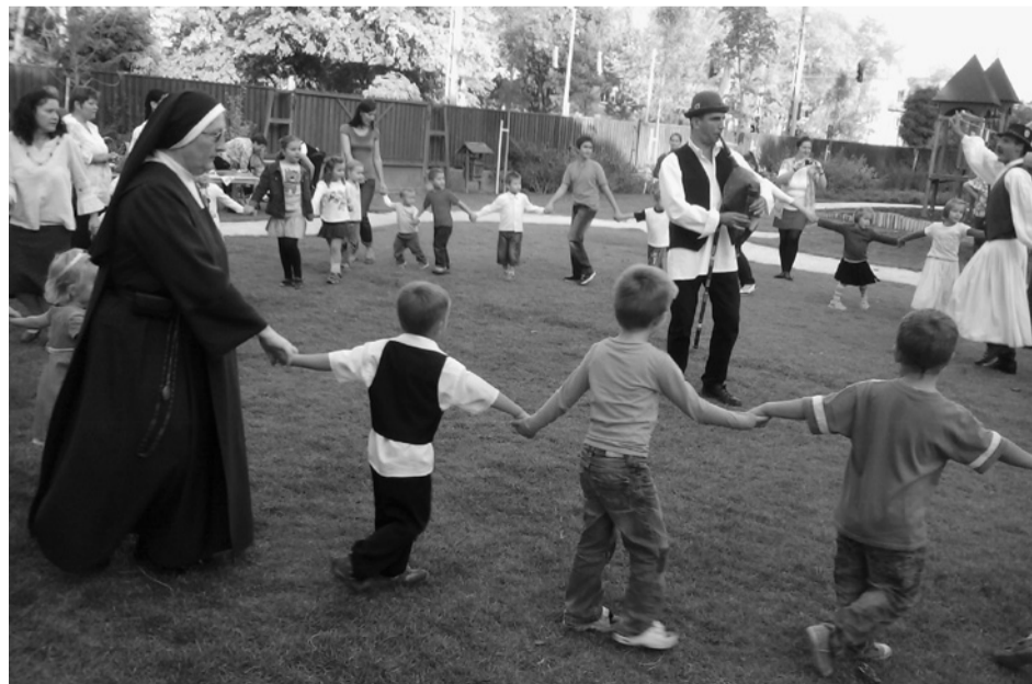
A Karmel Kiskertje Óvoda udvarán 2012. szeptember 28-án

Az intézmény két óvodai csoporttal működik. A csoportszobák esztétikusak, tágasak, világosak, galériával beépítettek. Számos játszó-, foglalkoztatóterület kialakítását teszi lehetővé. Mindkét csoportnak saját laptopja, fénymásolója van. A két csoport külön, szekrényekkel berendezett öltözővel, modern felszerelésű mosdóval (szenzoros szappan- és papírtörölgadagolóval) rendelkezik. Az óvodának nagy tornaterme van korszerű, sokféle hasznos, fejlesztő, szórakoztató felszereléssel, ahol a gyerekek kiélhetik mozgásvágyukat. Esős idő esetén a sósobát vehetik birtokba, ahol egészségserkentő és -megőrző környezetben vannak: hangulatvilágítással épültek a falak sötétglázból, a gyerekek a sóval „homokozhatnak”, körben a padok alatt kőszék található. Nyári időben búcsúestet tartanak nagycsoportosok számára, és a testvéróvoda nagycsoportosai is érkeznek vendégségbe. Velük a nagykádas szobát is igénybe veszik, amelyet a gyerekek évente igazi legendás helyként izgalommal, kitüntetéssel emlegetnek, amit a zene