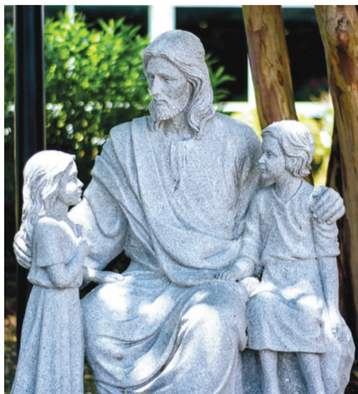
A Mester tanítja a gyermekeket

Ferenc pápa ez alkalommal is felemelte szavát a háborúk ellen. Arra buzdított, hogy kísérjük el szeretetünkkel és imáinkkal azokat, akik nem tudtak elzáródni Portugáliába a konfliktusok miatt. Földrészünkre gondolva nagy fájdalommal adott hangot a „kedves Ukrajna” miatt, amely továbbra is sokat szenved, majd így folytatta: „Barátaim, engedjétek meg nekem, idős embernek, hogy veletek, fiatalokkal megosszak egy álmot, amelyet szívemben hordozok: ez a béke álma, azoknak a fiataloknak az álma, akik a békéért imádkoznak, békében élnek és a béke jövőjét építik. Hazatérve továbbra is imádkozzatok a békéért. Ti a béke jele vagytok a világnak, tanúságtétel arról, hogy a különféle nemzetiségek, nyelvek és történelmek egyesíthetnek, ahelyett, hogy megosztanak. Egy másmilyen világ reménye vagytok. Köszönet ezért és haladjatok tovább ezen az úton!” – bizta a küldetést a világ fiataljaira Ferenc pápa, majd Mária, a Béke Királynője kezébe helyezte az emberiség jövőjét. A Szentatya végül meghívta a fiatalokat, hogy 2025-ben Rómában együtt ünnepeljék a Fiatalok Jubileumát, majd bejelentette, hogy a következő – negyvenedik – Ifjúsági Világtalálkozónak 2027-ben Ázsia, Dél-Korea ad otthont, helyszíne Szöul lesz.