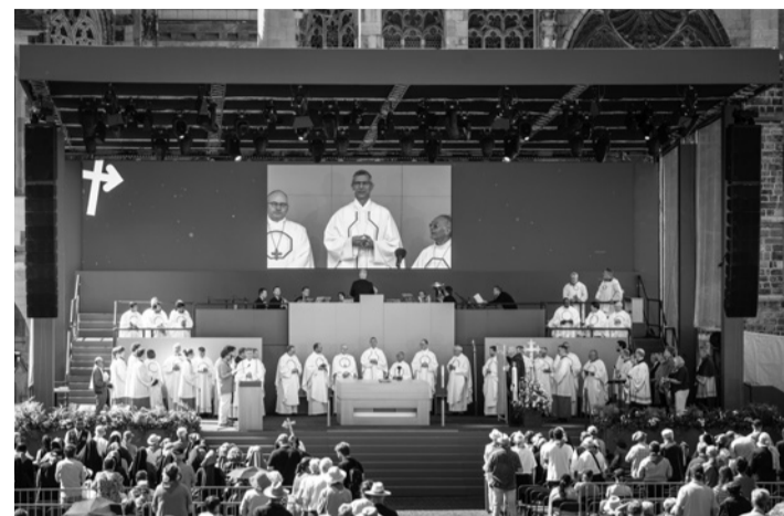
Felvétel a szentmiséről

Június 17-én újabb különleges élményben lehetett részünk: a németországi, belgiumi és luxemburgi magyar közösségek tartottak zarándoknapot az aacheni Szent Adalbert-templomban. Az ünnepi szentmise főcelebránsa Belényesi József frankfurti magyar plébános volt. A teljesen megtelt