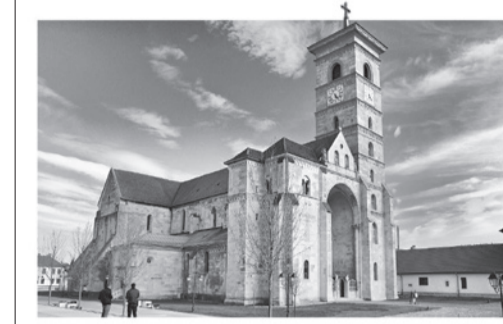
A gyulafehérvári székesegyház

Néhány szubjektív emlék. 1988-ban Bálint Lajos érsek felemelő papszentelésén vettünk részt (22 kispapot szenteltek akkor). Tizenegy évvel később a következőket írtam: