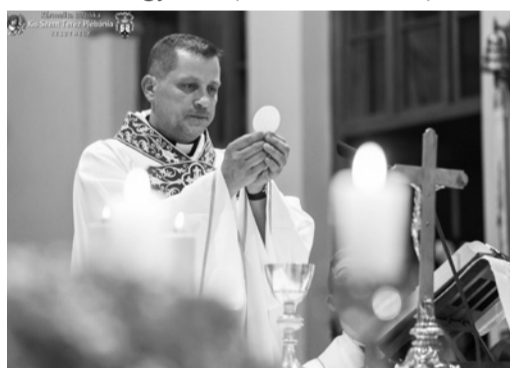
Újmisésként Keszthelyen

gard lelkipásztori egységben Feketeváros (Purbach), Fertőszéleskút (Breitenbrunn), Fertőfőhegyregháza (Donnerskirchen) és Sérc