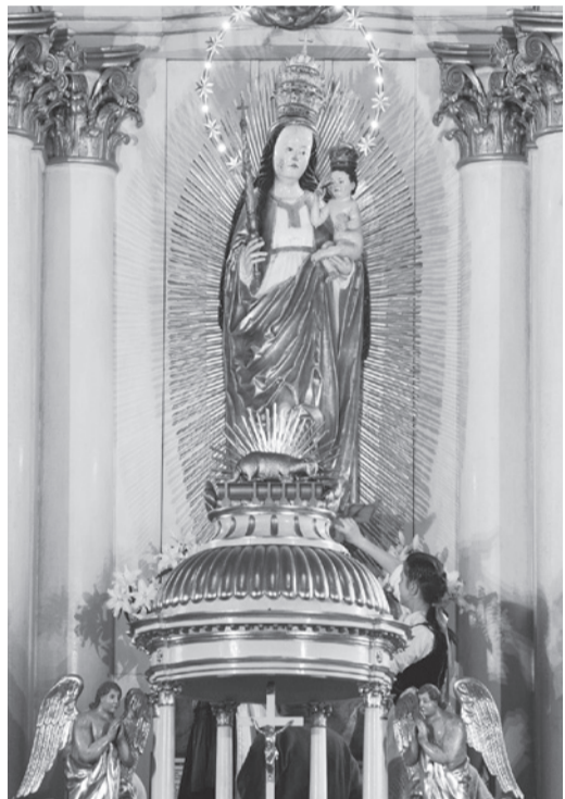
A csíksomlyói kegyesobor

Prohászka Ottokár neves hitszónok és püspök 120 évvel ezelőtt Tusnád-füred című munkájában a következőket írja: „Magyarország határain német, vend, horvát, tót, rutén, román ül. Magyarország hullámos palástját ezek szegélyezik. Csak egyetlen tiszta magyar csíkot varrt az ország szegélyébe a Gondviselés, aranyos, paszományos csíkot, s ezt a csíkot ma is Csíknak hívják. Ez a Csík egy foszlány Attila népéből, egy csík a régi Hunnia palástjából, mely leszakadt, mikor a palást szétszakadt, s ott akadt fönn a Hargita