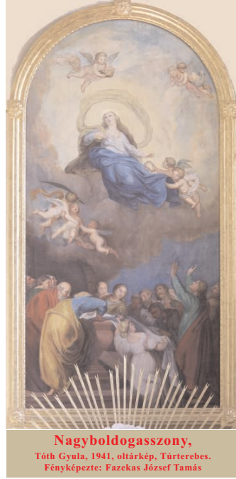
Nagyboldogasszony, Tóth Gyula, 1941. oltárkép, Túrterebes.

A médiára való nevelésnek pozitívnak kellene lennie. Ha azt mutatjuk a gyerekeknek, ami esztétikailag és erkölcsileg kiemelkedő, segítjük őket, hogy saját véleményük alakuljon ki, megmondottak legyenek, és fejlődjön az ítéletképességük. Fontos, hogy felismerjük a szülői példamutatás alapvető értékét, és előnyös megismertetni a fiatalokkal a gyermekirodalom, a szépművészet és a magas zene klasszikusait. Bár a népszerű irodalomnak mindig meglesz a maga helye a kultúrában, a szenzációkeltés csábítását nem szabadna passzí- (Folytatás a 4. oldalon)