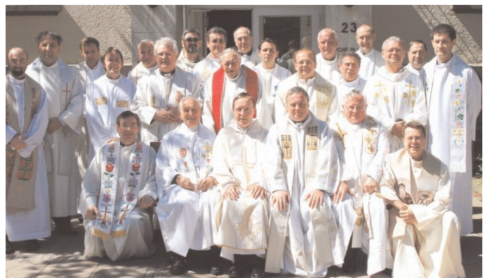
2007. május 1-én, mise után a magyar papi konferencia résztvevői Königsteinben, az OPH székházának főbejáratánál