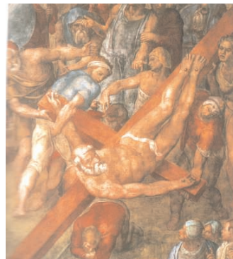
Péter apostol keresztre feszítése, Michelangelo, Cappella Paolina, Vatikán

első századtól fogva körülvette Szent Péter sírját. Legújabbban pedig arról is hírt kaptunk, hogy a Szent Pál-bazilika központi oltára alatt azonosították Szent Pál apostol szarkofágját is.