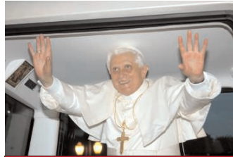
Brazíliaba látogatott a Szentatya

Hatnapos brazíliai látogatása során XVI. Benedek pápa május 11-én ünnepélyes szentmise keretében szenté avatta Boldog Frei Antônio de Sant'Anna Galvão ferences szerzetest. A szentmisén koncebrálók között volt Erdő Péter bíboros, az MKPK és az Európai Püspöki Konferenciák Tanácsának elnöke.